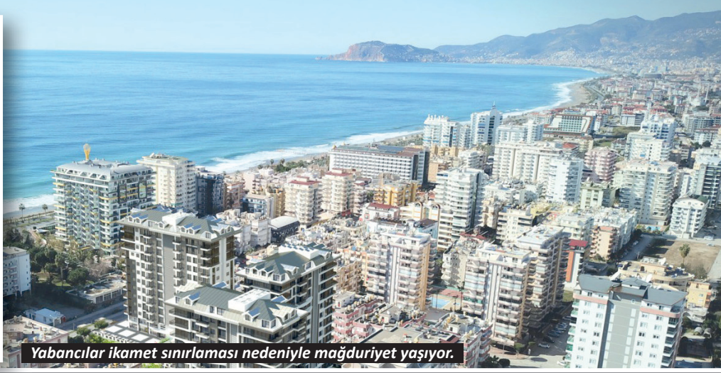
Yabancılar ikamet sınırlaması nedeniyle mağduriyet yaşıyor.

Tuncer, "Yabancılar ülkemizde konut yatırımı yapsalar da kapalı mahallelerde ikamet alamadıkları için mağduriyet yaşıyor. 2022 yılından bu yana en çok tercih edilen Mahmutlar, Kargıcak, Avsallar ve Kestel mahallelerimiz ikamete kapalı durumda. Bu durum, varlığını Türkiye'ye taşımak isteyen yatırımcıda hayal kırıklığı yaratıyor" dedi.