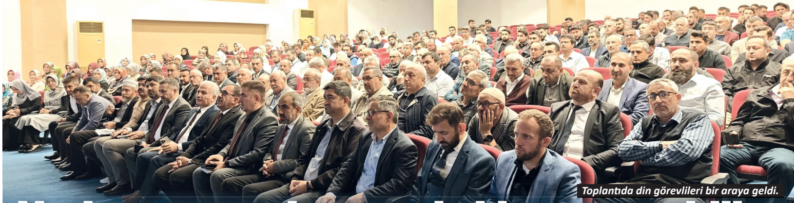
Toplantıda din görevlileri bir araya geldi.

1 ünite kan bağışı ile 3 kişinin hayatını kurtarıp doğaya 3 adet fidan bağışladınız. İyi ki varsınız kan dostları!” dedi. – Erkan Uysal