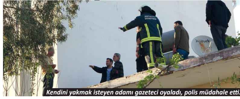
Kendini yakmak isteyen adamı gazeteci oyaladı, polis müdahale etti.