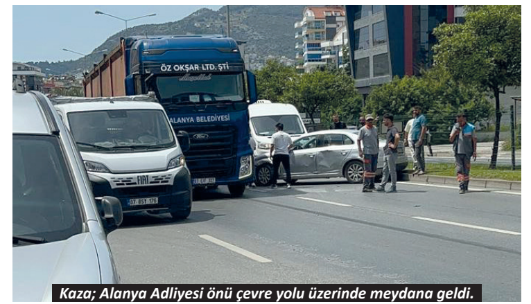
Kaza; Alanya Adliyesi önü çevre yolu üzerinde meydana geldi.

Yangından etkilenenlerin olma ihtimaline karşı 112 Acil Sağlık ve özel hastanelere ait ambulanslar yangın tamamen söndürülünceye kadar otel çevresinde tedbir amacıyla bekledi.-İHA