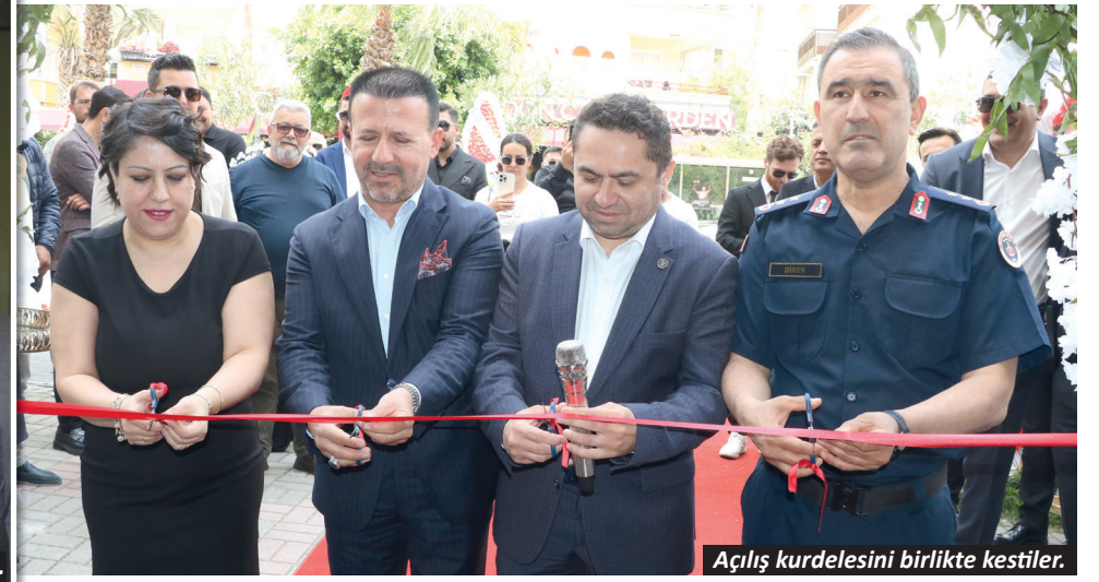
Açılış kurdelesini birlikte kestiler.