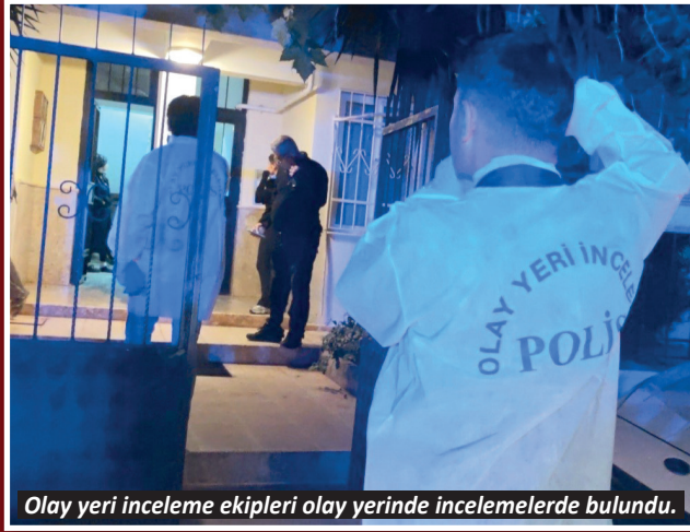
Olay yeri inceleme ekipleri olay yerinde incelemelerde bulundu.

kontrolde 16 yaşındaki çocuğun hayatını kaybettiği belirlendi. Olayı duyup eve gelen annenin 'oğlum' feryatları yürekleri yaktı. Evde yapılan incelemede pompalı tüfek bulunduğu öğrenildi. Polis ekipleri olayla ilgili inceleme başlatırken, Mert K.A.'nın cenazesi olay yerine inceleme ekiplerinin çalışmasının ardından Antalya Adli Tıp Kurumu Morgu'na kaldırıldı.-İHA