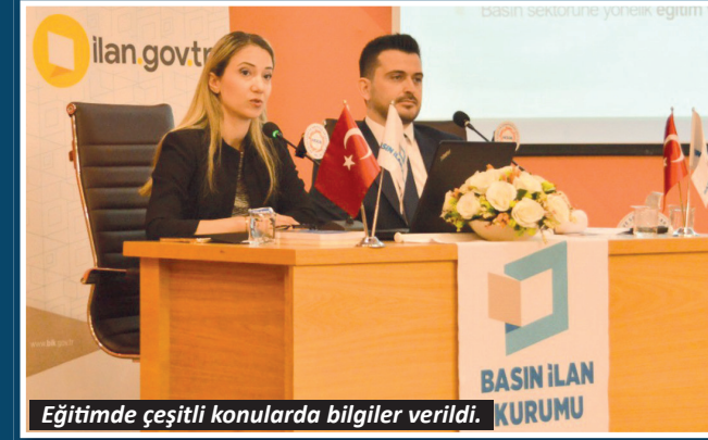
Eğitimde çeşitli konularda bilgiler verildi.

Özellikle internet haber sitelerinin resmî ilan ve reklam ekosistemine dâhil edilmesinin ardından dijital yayıncılık alanında önemli bir dönüşüm yaşandığını vurgulayan Uluçamlıbel, "Dijital yayıncılık sürekli gelişen ve kendini yenileyen bir alan. Kurum olarak bizler de bu değişimi yakından takip ediyor, yayınlarmızın süreç