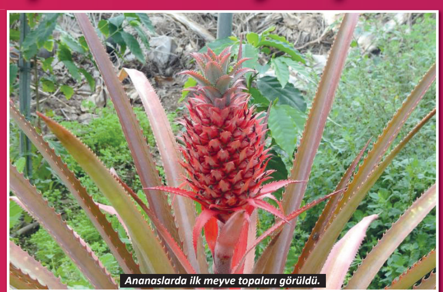
Ananaslarda ilk meyve topaları görüldü.

Alanya'da tropikal meyve üretimi her geçen yıl çeşitlenirken, deneme amaçlı ekilen ananaslarda ilk meyve topalarının görülmesi üreticiyi heyecanlandırdı.