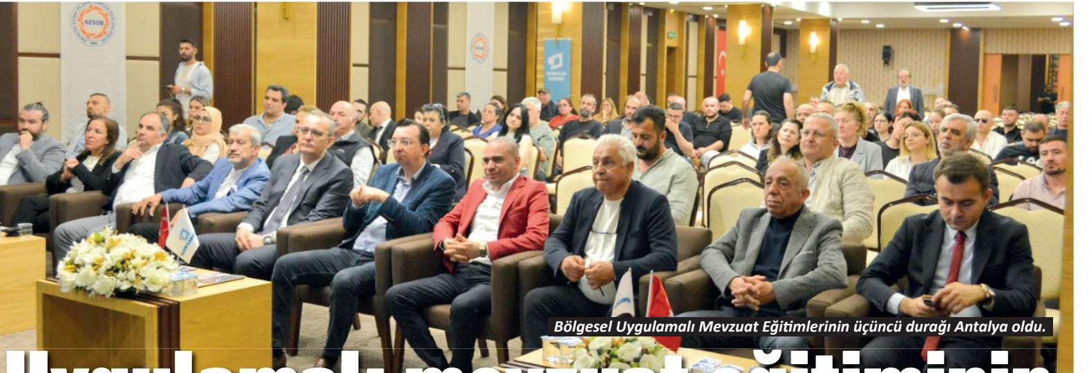
Bölgesel Uygulamalı Mevzuat Eğitimlerinin üçüncü durağı Antalya oldu.