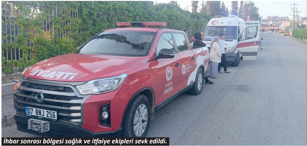
İhbar sonrası bölgeye sağlık ve itfaiye ekipleri sevk edildi.

Manavgat'ta bir otelin çamaşırhanesinde çıkan yangın itfaiye ekiplerinin müdahalesi ile büyümeden söndürüldü.