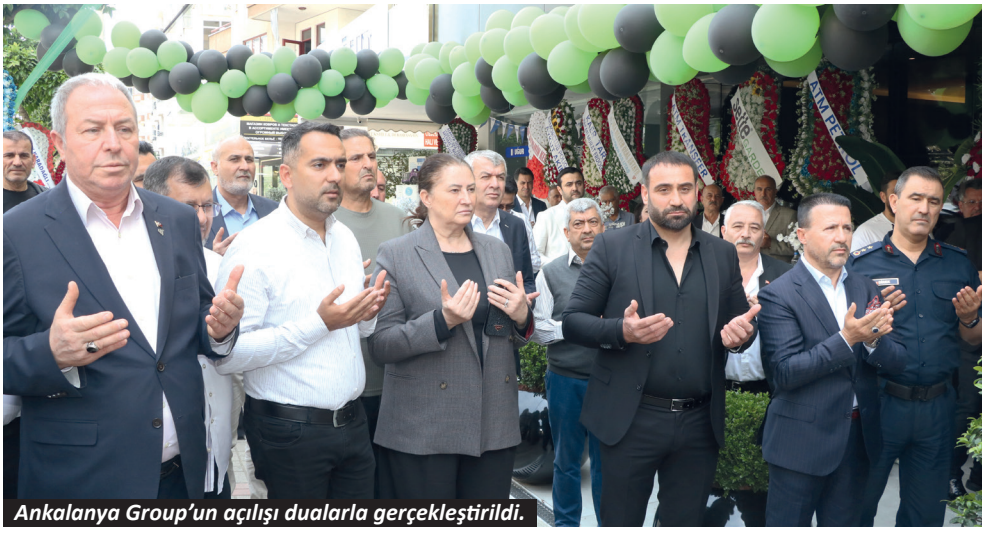
Ankalanya Group'un açılış dualarıyla gerçekleştirildi.