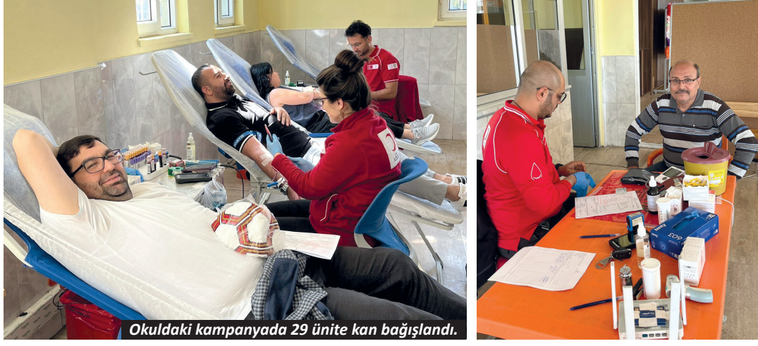
Okuldaki kampanyada 29 ünite kan bağışlandı.