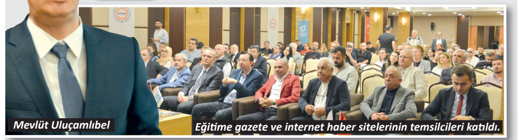
Eğitime gazete ve internet haber sitelerinin temsilcileri katıldı.

Basın İlan Kurumu Genel Müdürlüğü tarafından resmi ilan ile reklam yayımlayan basın kuruluşlarına yönelik düzenlenen Bölgesel Uygulamalı Mevzuat Eğitimlerinin üçüncü durağı Antalya oldu. Basın İlan Kurumu Antalya Bölge Müdürlüğü'nün ev sahipliğinde,