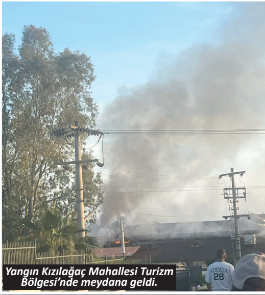
Yangın Kızılağaç Mahallesi Turizm Bölgesi'nde meydana geldi.

Manavgat'ta Kızılağaç Mahallesi Turizm Bölgesi'nde bulunan otelde çıkan yangın, Antalya Büyükşehir Belediyesi İtfaiyesi Manavgat Birimi, 112 Sağlık ve Manavgat İlçe Jandarma Komutanlığı