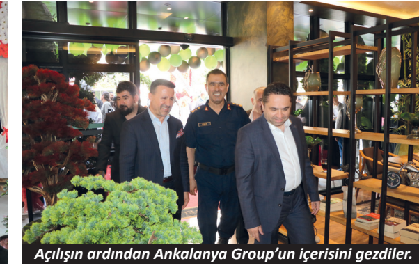
Açılışın ardından Ankalanya Group'un içerisini gezdiler.