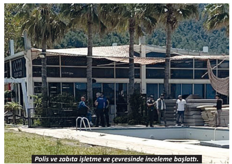
Polis ve zabıta işletme ve çevresinde inceleme başlattı.

Alanya'da ihale süreciyle kamuoyunun gündeminden düşmeyen Occo Beach Club'da ortaklar arasında çıkan tartışmanın bıçaklı kavgaya dönüştüğü ve olayda bir işletme ortağının yaralandığı iddia ediliyor.