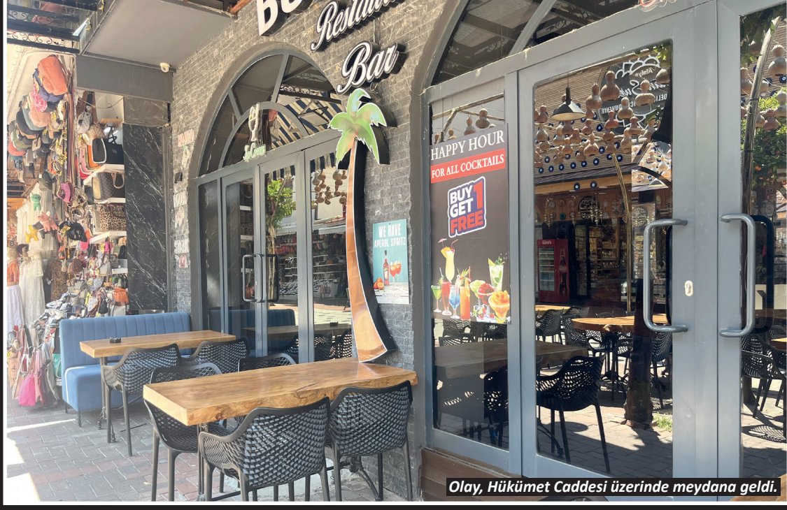
Olay, Hükümet Caddesi üzerinde meydana geldi.

Olay, önceki gün akşam saat 23.30 sıralarında Hükümet Caddesi üzerinde bulunan bir iş yerinde meydana geldi. Edinilen bilgilere göre, M.A. ile Ö.A. isimli şahıslar arasında henüz bilinmeyen bir nedenle tartışma çıktı. Tartışmanın büyümesi üzerine M.A., yanında bulunan silahla Ö.A.'ya ateş açtıktan sonra olay yerinden kaçtı. Silah seslerini duyan vatandaşların ihbarı üzerine olay yerine sağlık ve polis ekipleri sevk edildi. Yaralanan Ö.A., sağlık ekiplerinin ilk müdahalesinin ardından hastaneye kaldırıldı. Öte yandan polis ekipleri olay yerinden kaçan şüpheli M.A.'nın yakalanması için geniş çaplı arama çalışması başlattı. Olayla ilgili inceleme sürüyor.-İHA