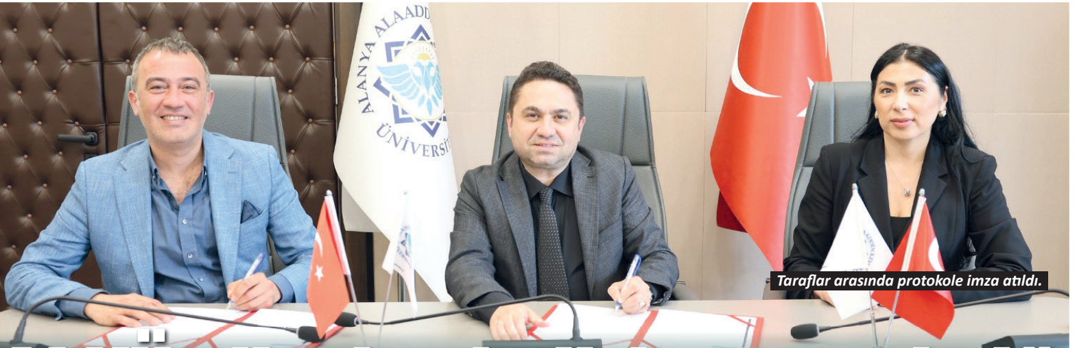
Taraflar arasında protokole imza atıldı.