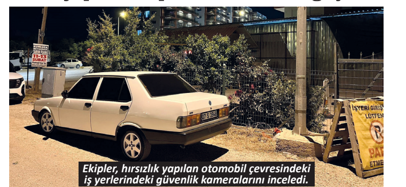
Ekipler, hırsızlık yapılan otomobil çevresindeki iş yerlerindeki güvenlik kameralarını inceledi.

Kumluca'da yaşanan otomobilden hırsızlık olayı polis ekiplerini harekete geçirdi.