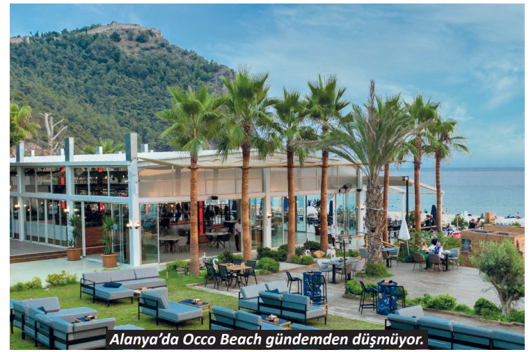
Alanya'da Occo Beach gündemden düşmüyor.