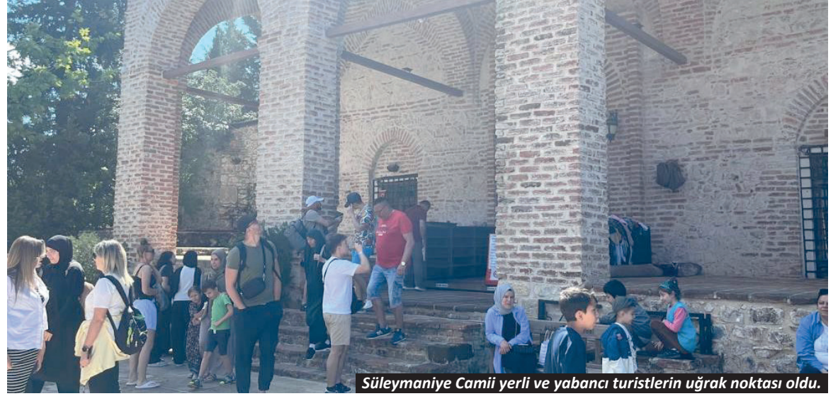
Süleymaniye Camii yerli ve yabancı turistlerin uğrak noktası oldu.