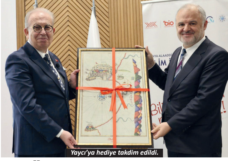
Yaycı'ya hediye takdim edildi.