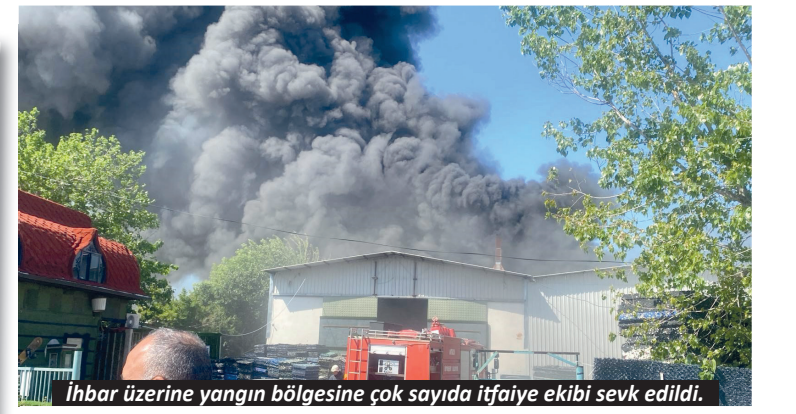
İhbar üzerine yangın bölgesine çok sayıda itfaiye ekibi sevk edildi.

Aksu'da bir depoda çıkan yangına çok sayıda itfaiye ekibi müdahalede bulunuyor.