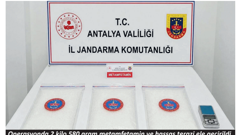
Operasyonda 2 kilo 580 gram metamfetamin ve hassas terazi ele geçirildi.