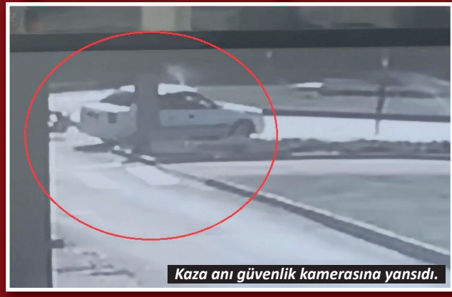
Kaza anı güvenlik kamerasına yansıdı.

Güvenlik kamerasına yansıyan kazada, otomobil içerisinde sıkışan 42 ADA 321 plakalı otomobilin sürücüsü İlhan K., Antalya Büyükşehir Belediyesi İtfaiyesi Manavgat Birimi'ne bağlı kurtarma ekibi tarafından araçtan çıkarıldı. Yaralı sürücü, 112 Sağlık ekiplerinin olay yerindeki müdahalesinin ardından ambulansla hastaneye kaldırıldı.-İHA