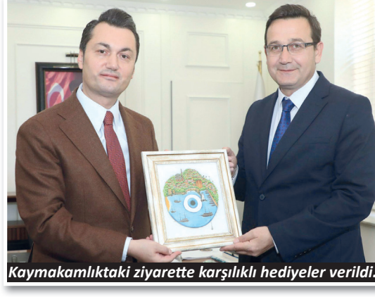
Kaymakamlıktaki ziyarette karşılıklı hediyeler verildi.