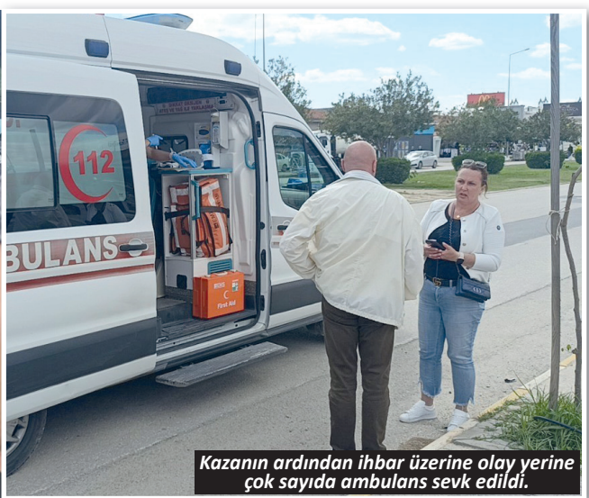
Kazanın ardından ihbar üzerine olay yerine çok sayıda ambulans sevk edildi.

Kaza, Manavgat'ta İlica Mahallesi Kumköy Cumhuriyet Bulvarı'nda meydana geldi. Edinilen bilgiye göre, Side'den Evrenseki istikametine seyir eden 07 J 2172 plakalı yolcu minibüsü, yolun sağ tarafında park halindeki 07 US 193 plakalı otomobile arkadan çarptı. Çarpmanın