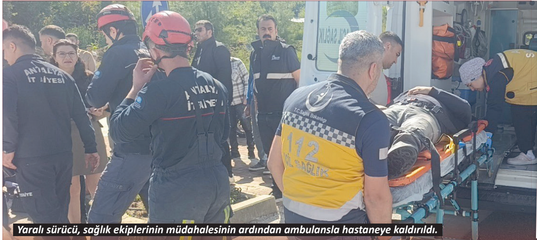
Yaralı sürücü, sağlık ekiplerinin müdahalesinin ardından ambulansla hastaneye kaldırıldı.

Aksu'nun Mandırlar Mahallesi Altın Oluk Caddesi üzerinde yer alan sentetik çim ve izolasyon şirketine ait bir depoda henüz bilinmeyen nedenle yangın çıktı. İhbar üzerine yangın bölgesine çok sayıda itfaiye ekibi sevk edildi. Ekiplerin yangına müdahalesi sürerken, polis ekipleri de güvenlik önlemi aldı.-İHA