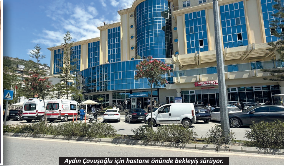
Aydın Çavuşoğlu için hastane önünde bekleyiş sürüyor.