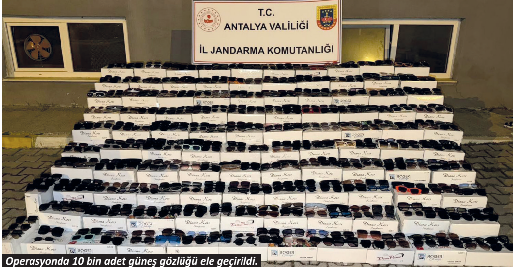
Operasyonda 10 bin adet güneş gözlüğü ele geçirildi.

Antalya İl Jandarma Komutanlığı ekipleri, kaçakçılık suçlarıyla mücadele çalışmaları kapsamında lüks markalara ait ürünlerin bulunduğu bir depoyu taktibe aldı. Alanya Cumhuriyet Başsavcılığı talimatları doğrultusunda belirlenen adrese operasyon düzenleyen ekipler, bir şahsa ait iş yerinde ve eklentilerinde arama yaptı. Yapılan aramada, gümrük kaçağı olduğu tespit edilen 10 bin adet güneş gözlüğü ele geçirildi. Ele geçirilen ürünlerin toplam piyasa değerinin yaklaşık 10 milyon lira olduğu belirtildi. Olayla ilgili bir şüpheli hakkında adli tahkikat başlatıldı.-Yasemin Kaya