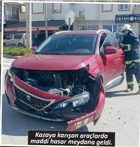
Kazaya karışan araçlarda maddi hasar meydana geldi.