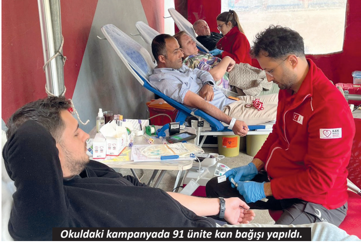
Okuldaki kampanyada 91 ünite kan bağışısı yapıldı.