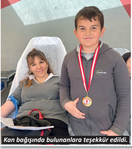
Kan bağışısında bulunanlara teşekkür edildi.

Alanya'da düzenlenen "Okulda KANpanya Var" projesi kapsamında Gönül Kemal Reisoğlu İlkokulu'nda 09.30 - 18.00 saatleri arasında 91 ünite kan bağışısı yapıldı.