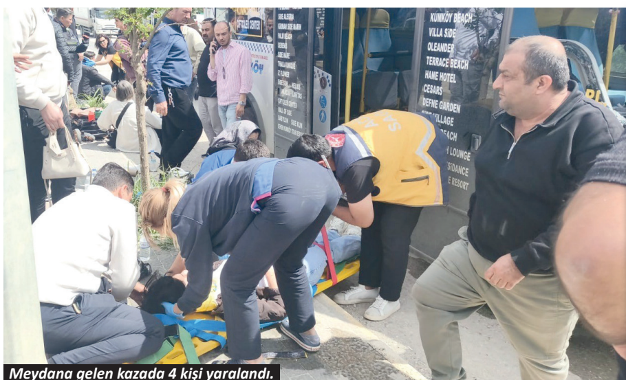
Meydana gelen kazada 4 kişi yaralandı.

Antalya'da bir yolcu minibüsünün yol kenarında park halindeki araca çarptığı kazada 4 kişi yaralandı.