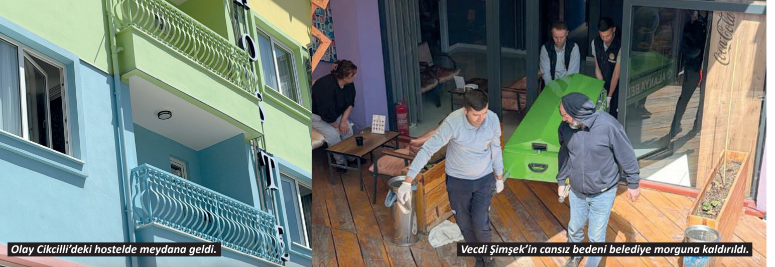
Olay Cıkıllı'deki hostelde meydana geldi.