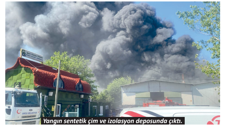
Yangın sentetik çim ve izolasyon deposunda çıktı.