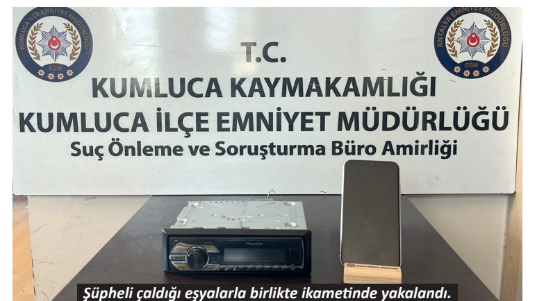
Şüpheli çaldığı eşyalarla birlikte ikametinde yakalandı.