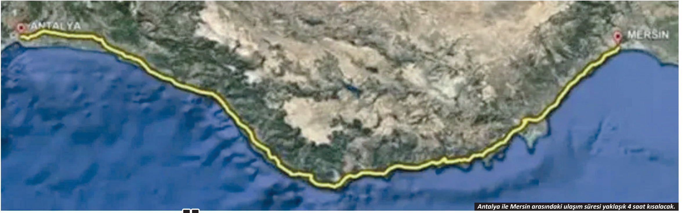
Antalya ile Mersin arasındaki ulaşım süresi yaklaşık 4 saat kısalacak.