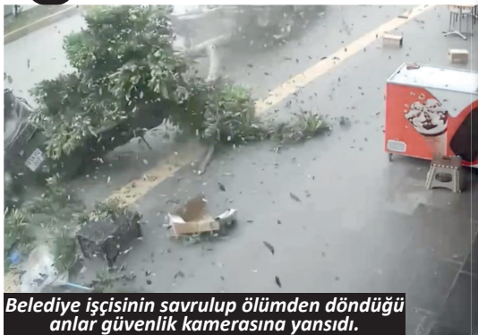
Belediye işçisinin savrulup ölümden döndüğü anlar güvenlik kamerasına yansıdı.

nin bulunduğu bildirildi. Nejat A.'nın kazayı haber alıp gelen yakınları gözyaşlarına boğuldu. Diğer taraftan 07 BZR 813 plakalı cipin çarptığı kaldırımdaki ağaç park halindeki 07 BFN 661, 07 AFF 516 ve 07 ATH 093 plakalı motosikletlerin üzerinde devrilerek motosikletlerde maddi hasar oluşmasına neden oldu.-İHA