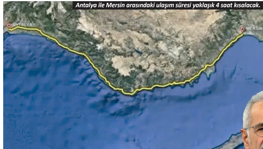
Antalya ile Mersin arasındaki ulaşım süresi yaklaşık 4 saat kısaltacak.

Ulaştırma ve Altyapı Bakanı Abdulkadir Uraloğlu, Akdeniz'in ulaşım çehresini değiştirecek dev yatırımda kritik aşamaya geldiğini duyurdu. Antalya ile Mersin arasındaki ulaşım süresini yaklaşık 4 saat kısaltacak olan Akdeniz Sahil Yolu Projesi, bölgedeki turizm ve ticaret trafiğine yeni bir soluk getirmeye hazırlanıyor.