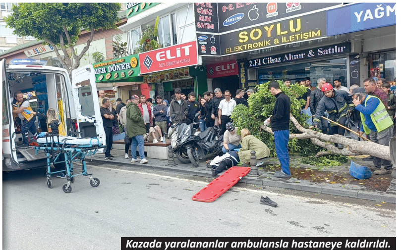
Kazada yaralananlar ambulansla hastaneye kaldırıldı.