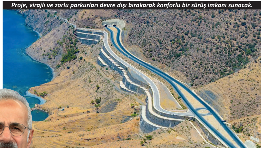
Proje, virajlı ve zorlu parkurları devre dışı bırakarak konforlu bir sürüş imkanı sunacak.