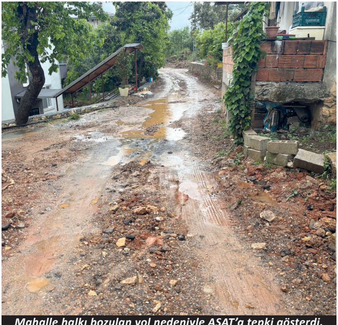
Mahalle halkı bozulan yol nedeniyle ASAT'a tepki gösterdi.