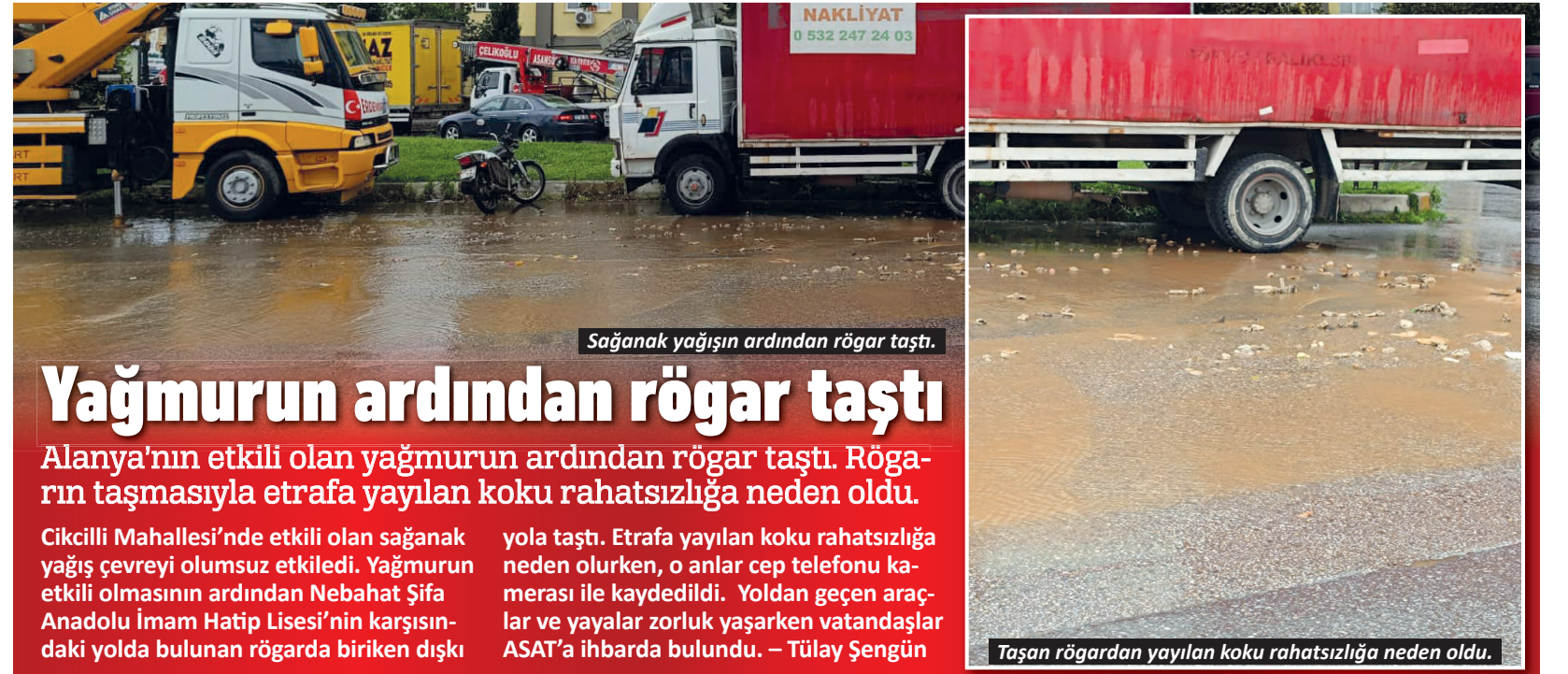
Sağanak yağışın ardından rögar taşı.

Alanya'da da aynı bilinç ve aynı dava şuurunu hareket ediyoruz. MHP Alanya İlçe Teşkilatı olarak; Başbuğumuz Alparslan Türkeş'in emanetine, Bilge Liderimiz Devlet Bahçeli'nin ortaya koyduğu milli duruşa ve 3 Mayıs ruhunun temsil ettiği Türk milliyetçiliği davasına sonuna kadar sahip çıkacağız. Hiç kimsenin Türk milletinin değerleriyle, devletimizin temel taşlarıyla ve ay yıldızlı bayrağımızla hesaplaşmasına sessiz kalmayacağız. 3 Mayıs ruhu; teslim olmayanların, susmayanların ve Türk milletinin geleceği için mücadeleden vazgeçmeyenlerin ruhudur. Bu ruh dün vardı, bugün vardır ve yarın da var olmaya devam edecektir. Bu vesileyle; Başbuğumuz Alparslan Türkeş'i, Hüseyin Nihal Atsız'ı, ülkücü şehitlerimizi ve Türk milliyetçiliği davasına ömür vermiş tüm dava büyüklerimizi rahmet, minnet ve dualarla anıyor; tüm ülküdaşlarımızın 3 Mayıs Milliyetçiler Günü'nü kutluyoruz. Ne mutlu Türk'üm diyene" diye konuştu. - Erkan Uysal