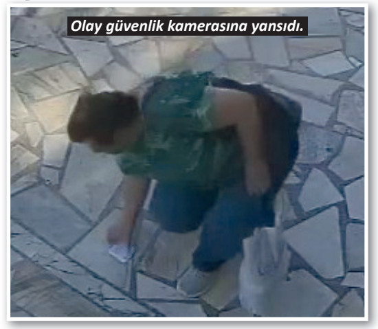
Olay güvenlik kamerasına yansıdı.

Alanya'da bir iş yeri sahibinin cebinden düşen 700 euroyu bulan kadın, parayı zabıta ekiplerine teslim etti.