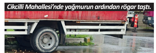
Cikcilli Mahallesi'nde yağmurun ardından rögar taşı.