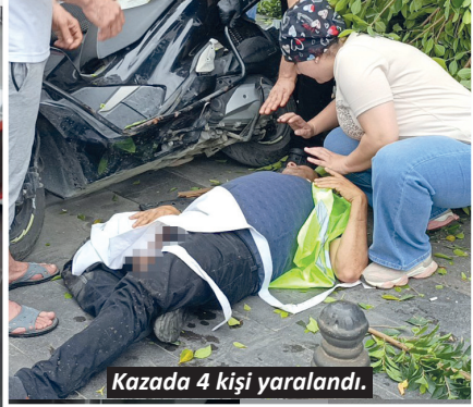
Kazada 4 kişi yaralandı.