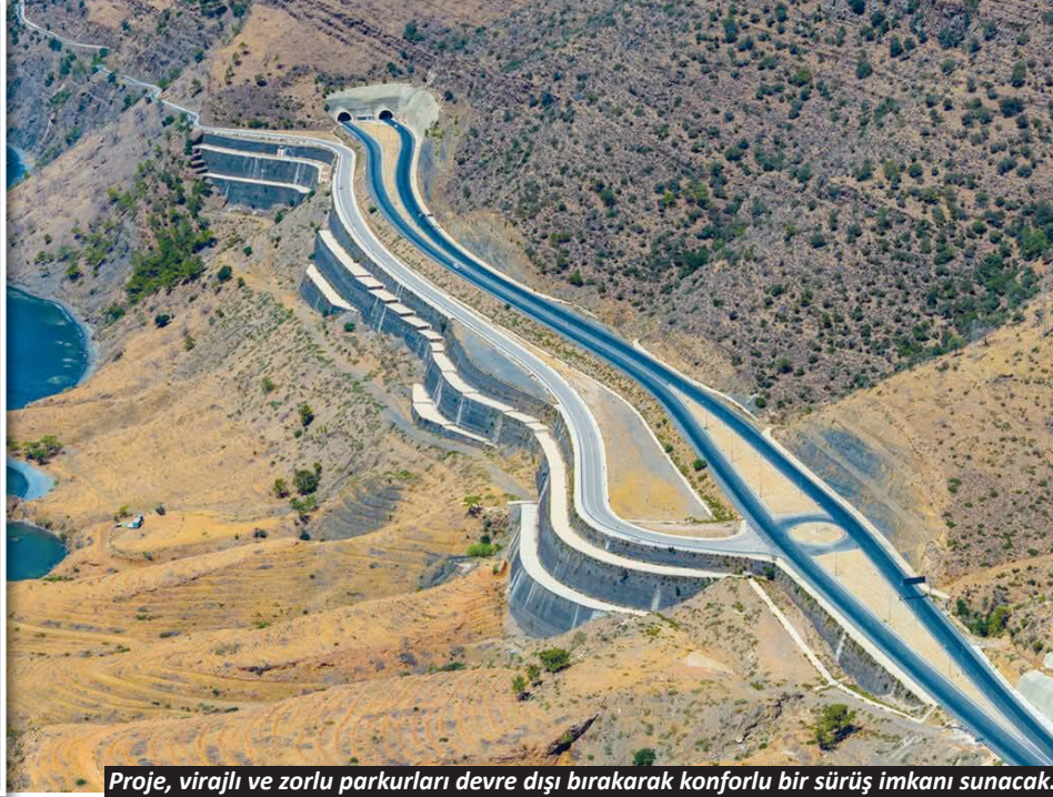
Proje, virajlı ve zorlu parkurları devre dışı bırakarak konforlu bir sürüş imkanı sunacak.

U LAŞTIRMA ve Altyapı Bakanı Abdulkadir Uraloğlu, Mersin programı kapsamında AK Parti İl Başkanlığı'na ziyaret ederek İl Başkanı Adem Aldemir ve partililerle bir araya geldi. Uraloğlu, buradaki konuşmasında Akdeniz'in ulaşım çehresini değiştirecek dev yatırımda kritik aşamaya geldiğini duyurarak ulaştırma alanında yapılan ve devam eden projeleri anlattı. ► 9,5 SAATLİK YOL 5 SAATE DÜŞÜYOR Bakan Uraloğlu'nun açıklamalarına göre, mevcut coğrafi koşullar ve yol standardı nedeniyle yaklaşık 9 saat 30 dakika süren Antalya-Mersin rotası, projenin tamamlanmasıyla birlikte 5 saat 50 dakikaya inecek. Sürücüler için hem yakıt hem de zaman tasarrufu sağlayacak proje, virajlı ve zorlu parkurları devre dışı bırakarak konforlu bir sürüş imkânı sunacak.