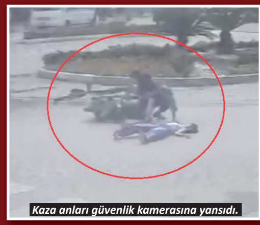
Kaza anları güvenlik kamerasına yansıdı.