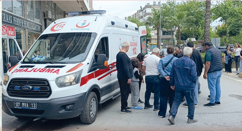
Yaralılar ambulansla hastaneye sevk edildi.