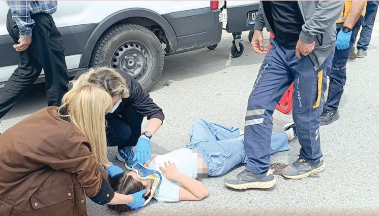
Meydana gelen kazada 2'si çocuk 3 kişi yaralandı.

bir süre açıkta etkili olduğu görülürken, hortum yerleşim alanına ulaşmadan deniz üzerinde etkisini yitirdi.-Erkan Uysal