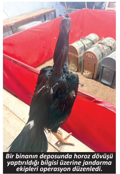
Bir binanın deposunda horoz dövüşü yaptırıldığı bilgisi üzerine jandarma ekipleri operasyon düzenledi.

Olay Avsallar Mahallesi'nde meydana geldi. Bir binanın depo bölümünde horoz dövüşü yaptırıldığı bilgisi üzerine jandarma ekipleri operasyon düzenledi. Baskında 11 kişi gözaltına alınırken, 7 horoz muhafaza altına alındı. Horoz dövüşürmek suretiyle kumar oynadıkları belirlenen 11 kişiye, toplam 143 bin 352 TL idari para cezası uygulandı. Organizasyonu sağladığı tespit edilen kişiye de '5199 sayılı kanuna muhalefet' suçundan adli işlem yapıldı.-Yasemin Kaya