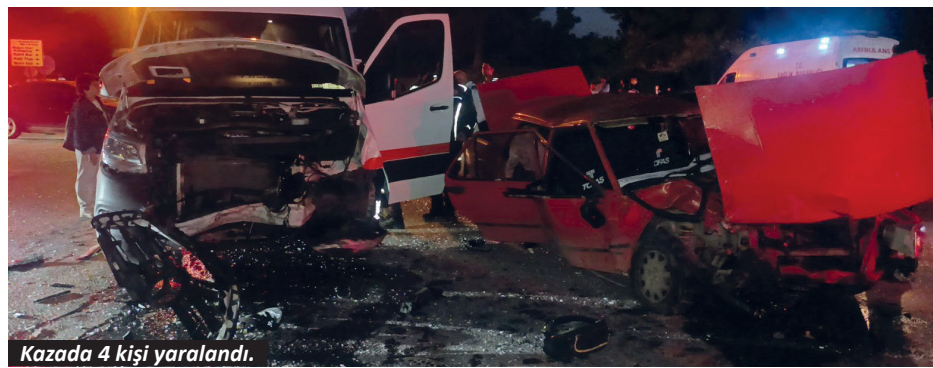
Kazada 4 kişi yaralandı.