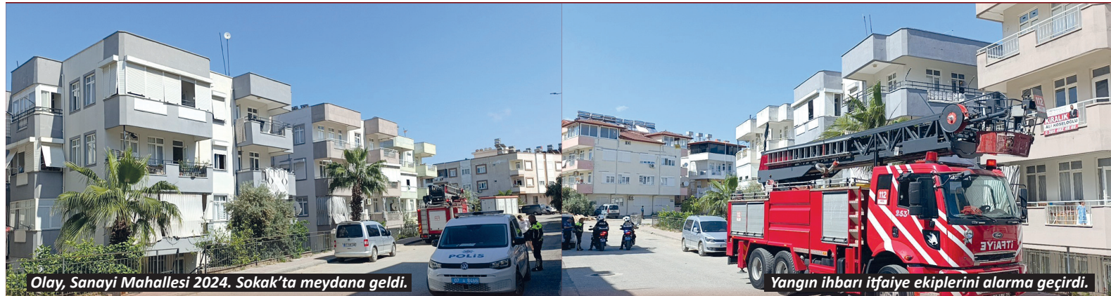
Olay, Sanayi Mahallesi 2024. Sokak'ta meydana geldi.