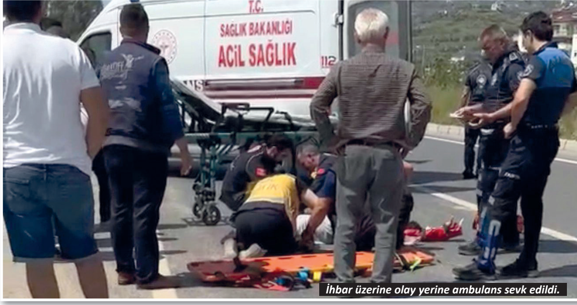
İhbar üzerine olay yerine ambulans sevk edildi.

Kaza Demirtaş Mahallesi'nde meydana geldi. Seyir halinde olan henüz ismi öğrenilemeyen hafif ticari araç, bisikletliyle ilerleyen kişiye çarptı. Kazada yola savrulan bisikletli yaralandı. Kazayı gören çevredeki vatandaşların ihbarı üzerine olay yerine gelen sağlık ekiplerince hastaneye kaldırılan kişi tedavi altına alındı.-Yasemin Kaya