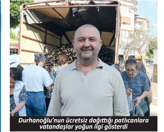
Durdahanoğlu'nun ücretsiz dağıttığı patlıcanlara vatandaşlar yoğun ilgi gösterdi

AK Partili Işık, "Keşke biz Antalya Büyükşehir Meclisi'nde olsaydık da bunları orada yüksek sesle dile getirebilseydik. Bu anlamda Büyükşehir meclis üyelerimize çok büyük görevler düşüyor. Alanya'nın belli bir kalitesi vardı, bu kaliteyi el birliğiyle tekrar oturttuğumuz şart" ifadelerini kullandı. 5'TE