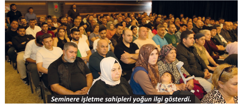
Seminare işletme sahipleri yoğun ilgi gösterdi.

Sorunların çözümü için Antalya Büyükşehir Belediyesi'ne nezdinde daha aktif bir mücadele verilmesi gerektiğini vurgulayan Işık, "Keşke biz Antalya Büyükşehir Meclisi'nde olsaydık da bunları orada yüksek sesle dile getirebilseydik. Bu anlamda Büyükşehir meclis üyelerimize çok büyük görevler düşüyor. Alanya'nın belli bir kalitesi vardı, bu kaliteyi el birliğiyle tekrar oturtmamız şart" diyerek yetkililere göreve davet etti. - Yasemin Kaya