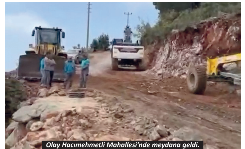
Olay Hacimehmetli Mahallesi'nde meydana geldi.