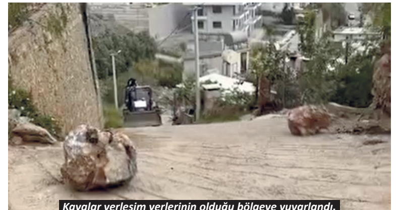
Kayalar yerleşim yerlerinin olduğu bölgeye yuvarlandı.

Alanya'da belediye ekiplerince yürütülen yol genişletme çalışması sırasında facianın eşiğinden dönüldü.