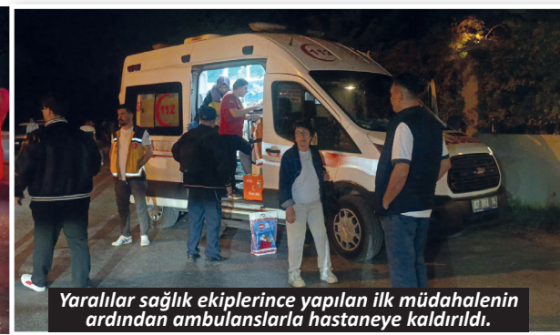
Yaralıları sağlık ekiplerince yapılan ilk müdahalenin ardından ambulanslarla hastaneye kaldırıldı.