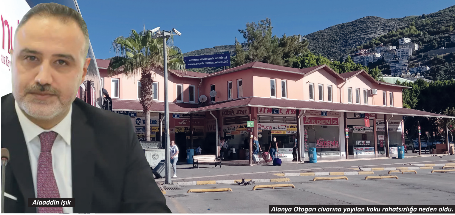
Alanya Otagarı civarına yayılan koku rahatsızlığa neden oldu.