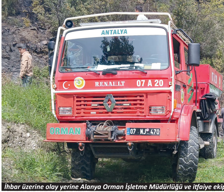
İhbar üzerine olay yerine Alanya Orman İşletme Müdürlüğü ve itfaiye ekipleri sevk edildi.