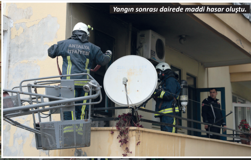
Yangın sonrası dairede maddi hasar oluştu.

Yangın, saat 13.00'te Hacet Mahallesi, Paşaaliler Sokak'ta bulunan 3 katlı bir apartmanın birinci katındaki dairede çıktı. Daireden dumanların yükseldiğini görenler 112 Acil Çağrı Merkezi'ne ihbarda bulundu. İhbar üzerine bölgeye itfaiye ve polis ekipleri sevk edildi. Yangın itfaiye ekibinin müdahalesi ile kısa sürede söndürülürken, binada maddi hasar oluştu.-Yasemin Kaya