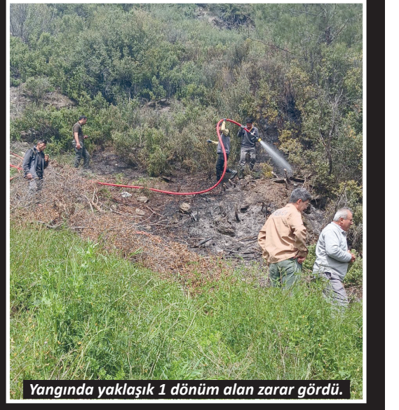
Yangında yaklaşık 1 dönüm alan zarar gördü.

YANGIN Şıhlar Mahallesi, Türbe Mevkii'nde çıktı. Henüz çıkış sebebi belirlenemeyen yangında makilik alandan alev ve dumanların yükseldiğini görenler hemen 112 Acil Çağrı Merkezi'ne ihbarda bulundu. İhbar üzerine bölgeye Alanya Orman İşletme Müdürlüğü ve itfaiye ekipleri sevk edildi. Yangın orman işletme ve itfaiye ekiplerinin müdahalesi ile söndürülürken, yangında yaklaşık 1 dönüm makilik alan zarar gördü.-Yasemin Kaya