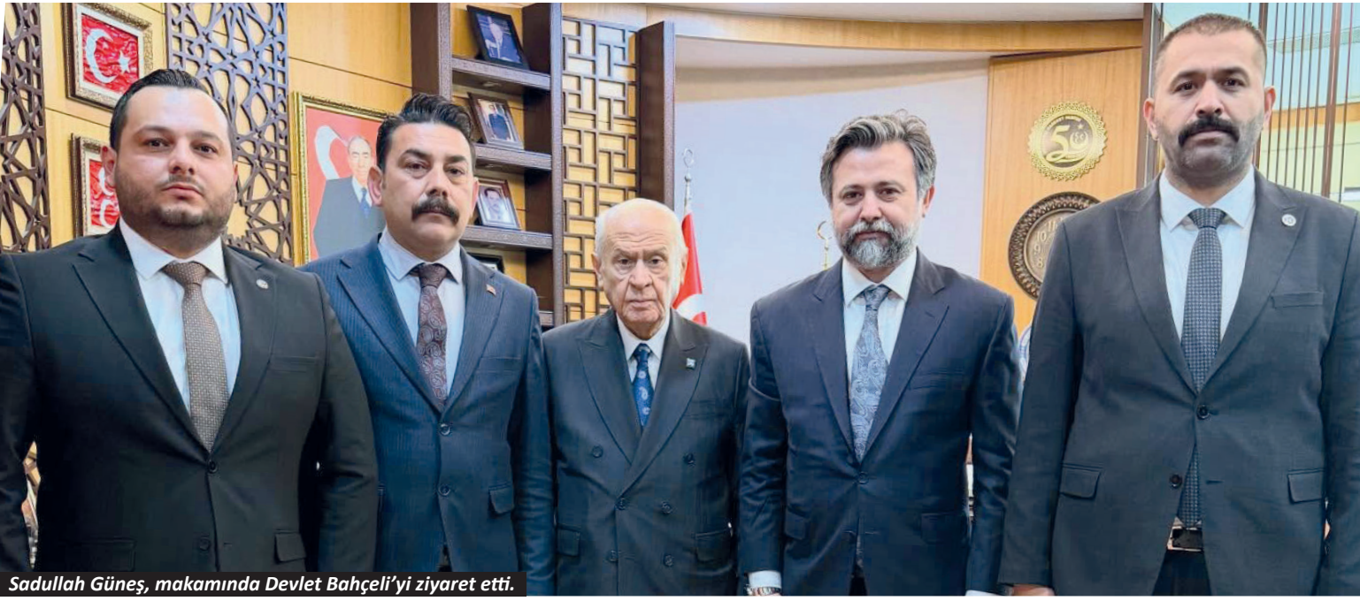
Sadullah Güneş, makamında Devlet Bahçeli'yi ziyaret etti.