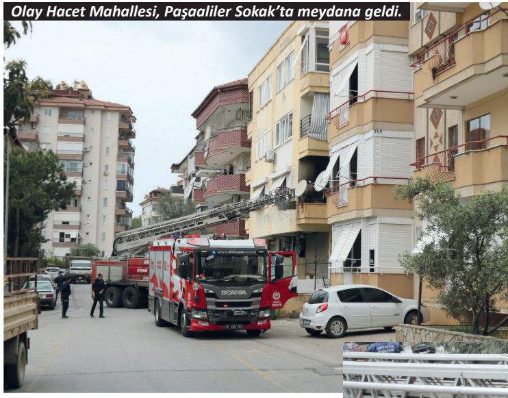
Olay Hacet Mahallesi, Paşaaliler Sokak'ta meydana geldi.

Yangın, saat 13.00'te Hacet Mahallesi, Paşaaliler Sokak'ta bulunan 3 katlı bir apartmanın birinci katındaki dairede çıktı. Daireden dumanların yükseldiğini görenler 112 Acil Çağrı Merkezi'ne ihbarda bulundu. İhbar üzerine bölgeye itfaiye ve polis ekipleri sevk edildi. Yangın itfaiye ekibinin müdahalesi ile kısa sürede söndürülürken, binada maddi hasar oluştu.-Yasemin Kaya