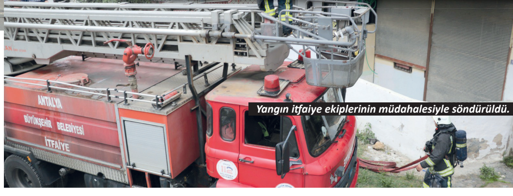
Yangın itfaiye ekiplerinin müdahalesiyle söndürüldü.