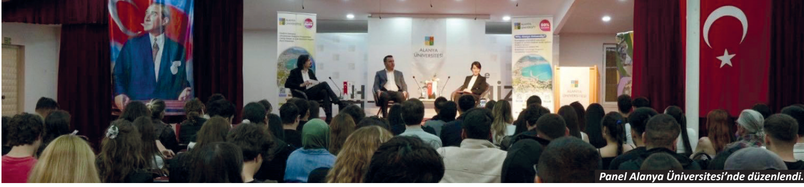
Panel Alanya Üniversitesi'nde düzenlendi.