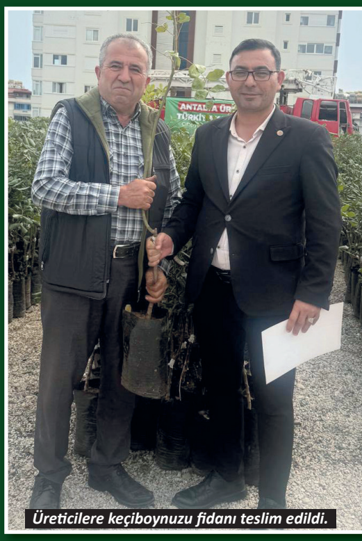
Üreticilere keçiboynuzu fidanı teslim edildi.