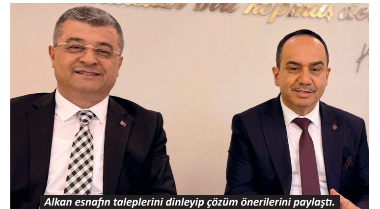
Alkan esnafın taleplerini dinleyip çözüm önerilerini paylaştı.