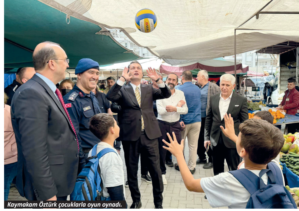
Kaymakam Öztürk çocuklarla oyun oynadı.

Alanya Kaymakamı Şakir Öner Öztürk, Mahmutlar Mahallesi'nde kurulan Salı Pazarı'nı ziyaret ederek esnaf ve vatandaşlarla bir araya geldi.