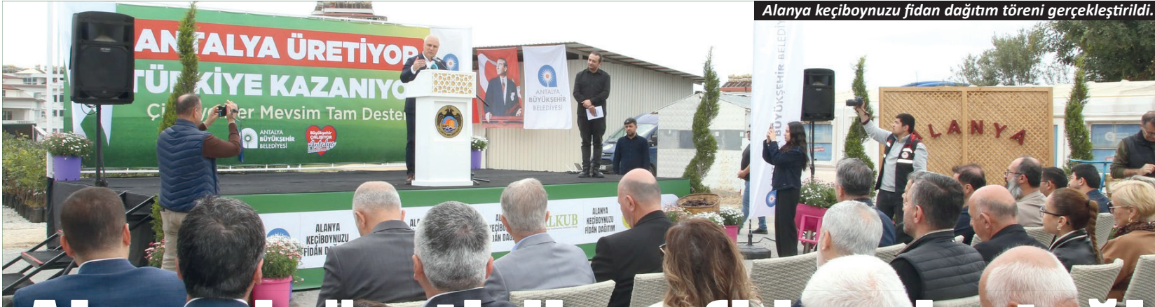
Alanya keçiboynuzu fidan dağıtım töreni gerçekleştirildi.