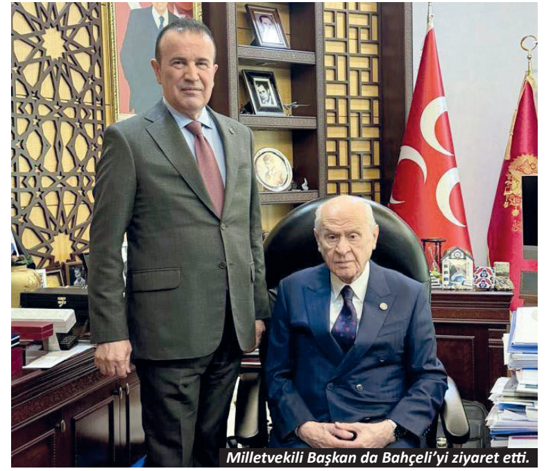
Milletvekili Başkan da Bahçeli'yi ziyaret etti.