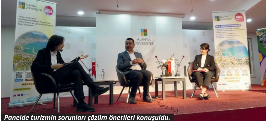
Panelde turizmin sorunları çözüm önerileri konuşuldu.

Alanya Üniversitesi, Turizm Haftası kapsamında düzenlediği paneller sektörün güncel sorunlarını ve geleceğe yönelik çözüm önerilerini gündeme taşıdı. "Güncel Turizm Sorunları ve Çözümler" başlığıyla gerçekleştirilen etkinlikte, bölge turizminin liderleri ve akademisyenler bir araya gelerek sektörün geleceğine dair stratejik çözüm yollarını tartıştı.