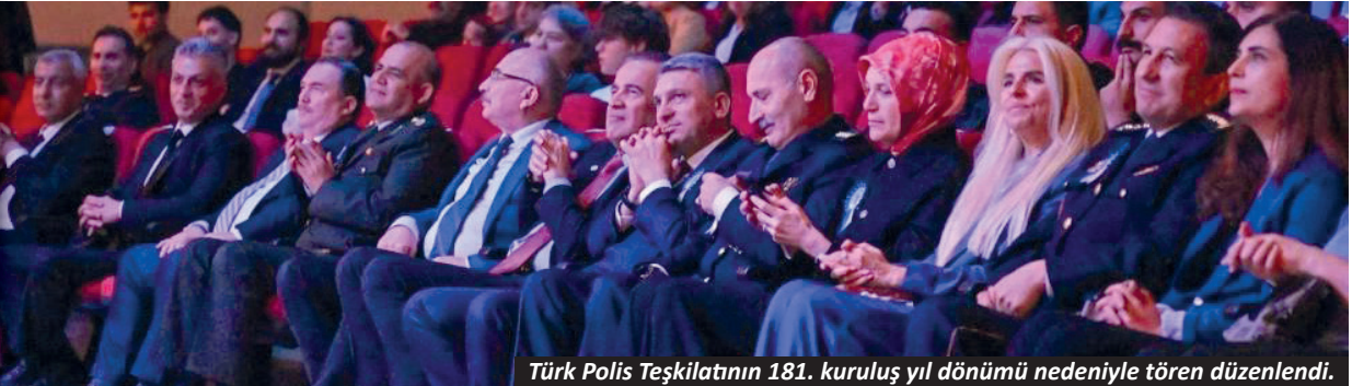
Türk Polis Teşkilatının 181. kuruluş yıl dönümü nedeniyle tören düzenlendi.