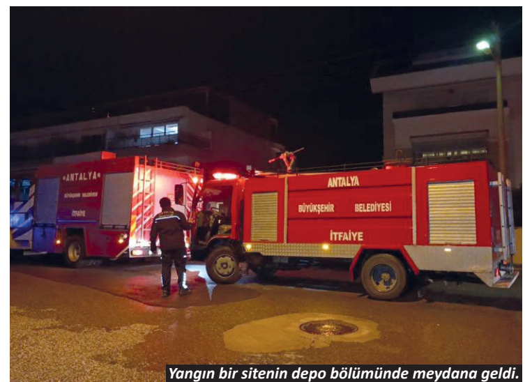
Yangın bir sitenin depo bölümünde meydana geldi.

Kaza, Aşağı Pazarıcı Mahallesi, 1027 Sokak'ta yaşandı. Edinilen bilgiye göre Pazartesi Pazarı istikametinden gelip 1033 Sokak istikametine gitmekte olan Esat K'nın kullandığı 07 CDF 138 plakalı motosiklet kavşakta Muharrem Ö'nün kullandığı 07 BTY 430 plakalı otomobile yandan çarptı. Güvenlik kamerasına saniye saniyesine yansıyan kazada yaralanan motosiklet sürücüsü 112 sağlık ekiplerinin olay yerindeki müdahalesinin ardından ambulansla hastaneye kaldırıldı. – İHA