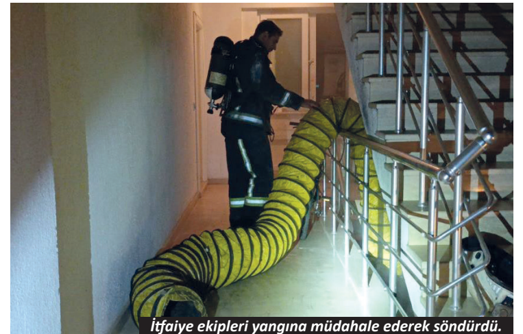
İtfaiye ekipleri yangına müdahale ederek söndürdü.

Manavgat'ta bir sitenin depo bölümünden yükselen duman ve yanık kokusu paniğe neden olurken, itfaiyenin müdahalesiyle olay büyümeden söndürüldü.