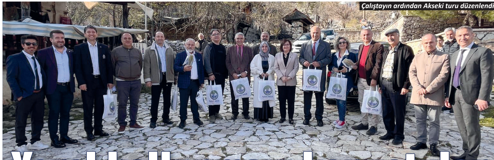
Çalıştayın ardından Akseki turu düzenlendi.

Tepe Mahallesi, 1218 Sokak'ta 1 aydır sokak lambaları yanmıyor. Mahalle sakinlerinin Alo 186'ya durumu bildirmelerine rağmen yetkililer halen soruna çözüm üretmedi. Yaşanan duruma isyan eden mahalle sakinlerinden bir vatandaş, “Zifiri karanlık. Burada 1 aydır sokak lambaları yanmıyor. Her taraf zifiri karanlık. Zaten toplam 3 lamba var. 3 defa bildirim yaptık. Arıza kaydı yaptık ama ne hikmetse AKEDAŞ ilgilenmiyor. Lambalar boşa duruyor. Lambaların hiçbiri yanmıyor” diye konuştu. – Erkan Uysal