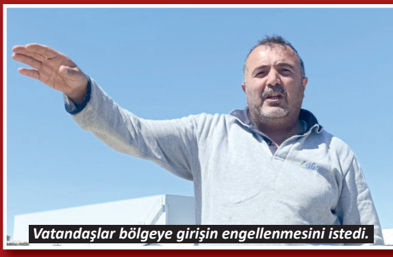
Vatandaşlar bölgeye girişin engellenmesini istedi.

Yangının meydana geldiği alanın yakınında iş yerleri bulunan vatandaşlar, bölgede sık sık benzer olayların yaşandığını belirterek duruma, "Ne yazık ki belediye girişi toprak yığarak kapatmasına rağmen buraya çöp ve moloz dökülmeye, hurdacılar tarafından da tel ve kablo çıkarmak için yakılmaya devam ediyor. Yetkililerden buraya giriş çıkışları tamamen engellemesini istiyoruz" sözleriyle tepki gösterdiler. – İHA