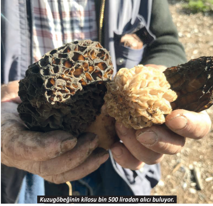
Kuzugöbeğinin kilosu bin 500 liradan alıcı buluyor.