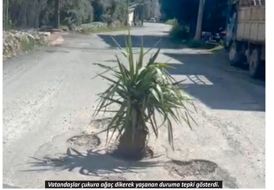
Vatandaşlar çukura ağaç dikerek yaşanan duruma tepki gösterdi.