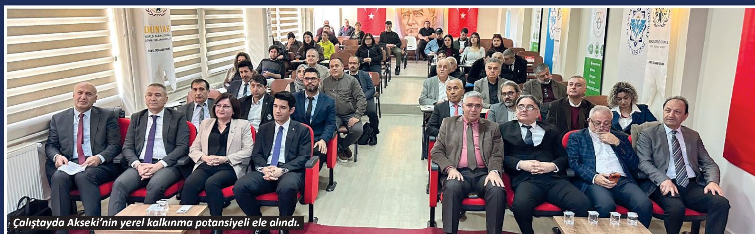
Çalıştayda Akseki'nin yerel kalkınma potansiyeli ele alındı.

ALKÜ Akseki MYO'da gerçekleşen “Transdisipliner Mentorluk ve Yerel Kalkınma Çalıştayı”nda Akseki'nin yerel kalkınma potansiyeli ele alındı.