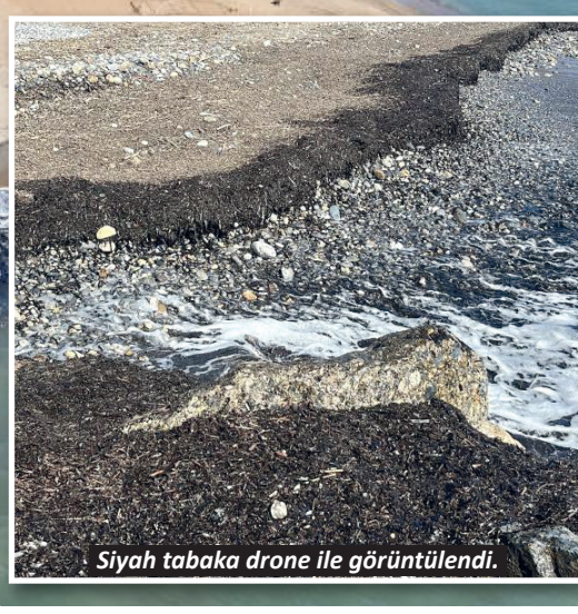
Sahilde oluşan siyah tabaka vatandaşları tedirgin etti.