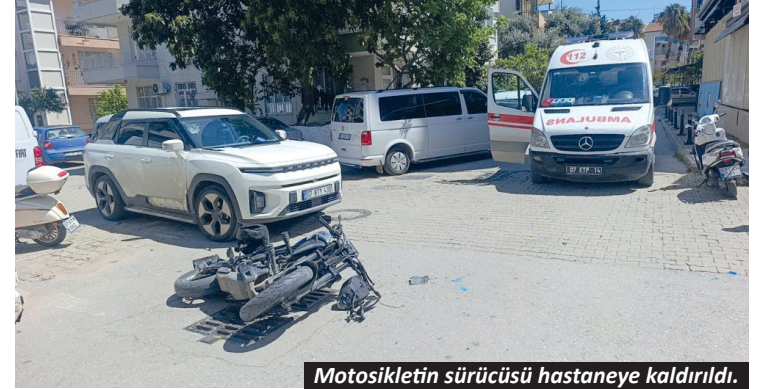
Motosikletin sürücüsü hastaneye kaldırıldı.