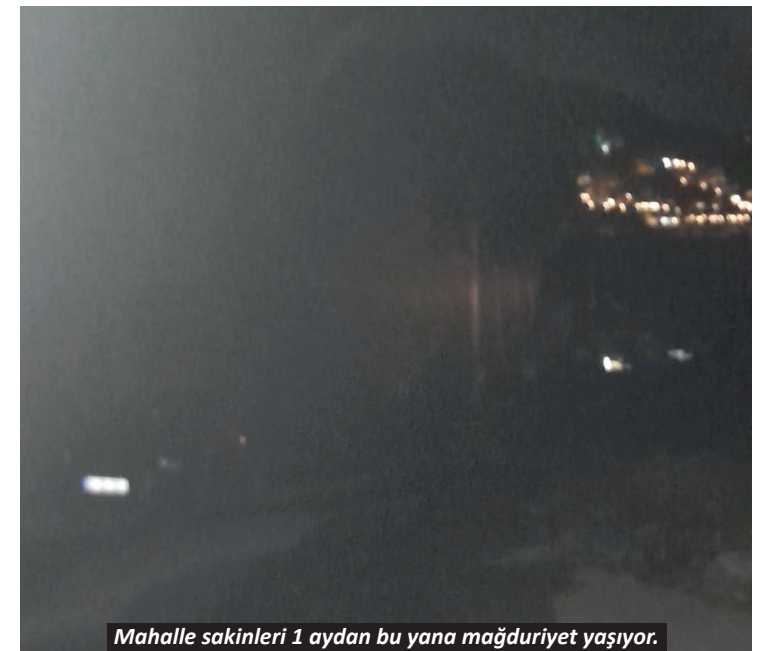
Mahalle sakinleri 1 aydan bu yana mağduriyet yaşıyor.