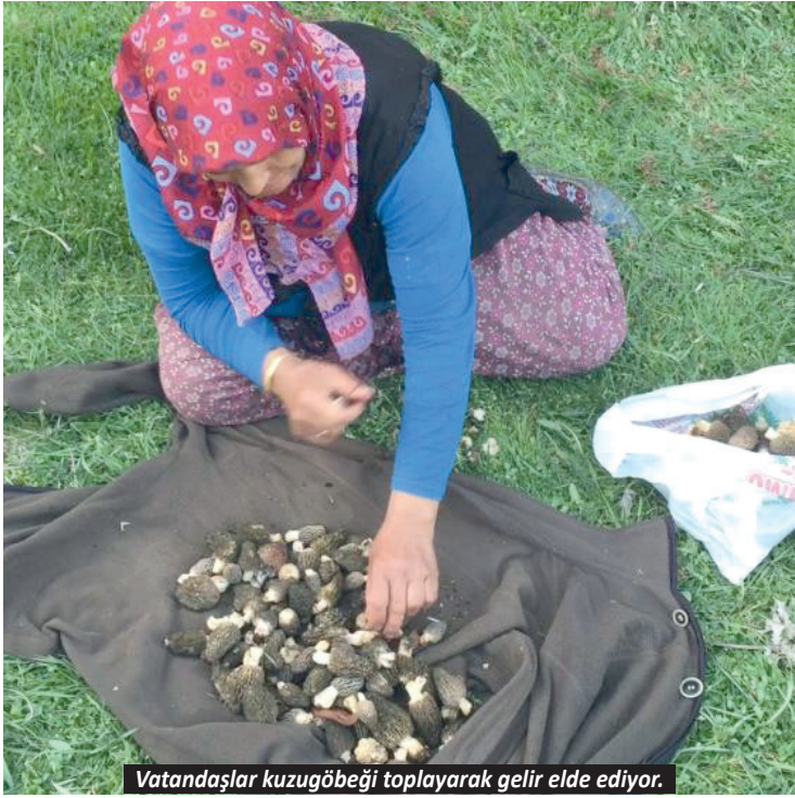
Vatandaşlar kuzugöbeği toplayarak gelir elde ediyor.

Akseki'de doğada kendiliğinden yetişen ve halk arasında "göbek" olarak bilinen kuzugöbeği mantarı sezonu başladı. Taze kuzugöbeğinin kilogramı ise bin 500 liradan alıcı buluyor.