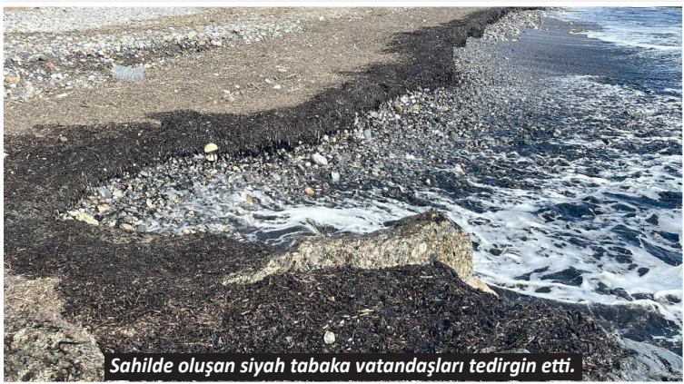
Sahilde oluşan siyah tabaka vatandaşları tedirgin etti.

Alanya'da 1 aydır yanmayan sokak lambaları mahalleliyi isyan ettirdi. Arıza kayıtlarına rağmen çözüm üretilmediğini belirten vatandaşlar, zifiri karanlıkta güvenlik endişesi yaşıyor. Tepe Mahallesi, 1218 Sokak'ta 1 aydır sokak lambaları yanmıyor. 5'TE