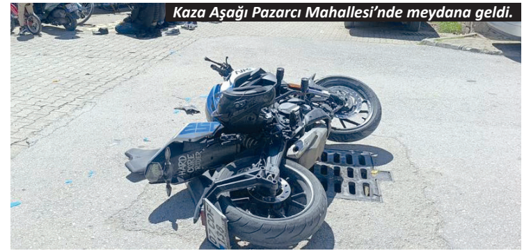
Kaza Aşağı Pazarıcı Mahallesi'nde meydana geldi.

Manavgat'ta motosikletin otomobile yandan çarpması sonucu meydana gelen kazada motosiklet sürücüsü yaralandı. Kaza anları güvenlik kamerasına yansdı.