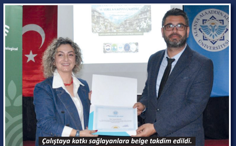
Çalıştaya katkı sağlayanlara belge takdim edildi.