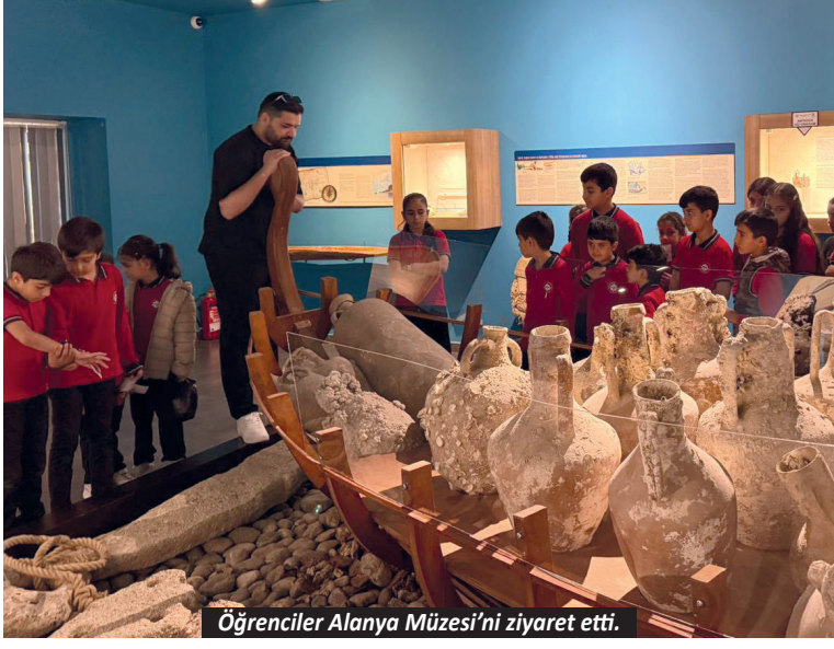
Öğrenciler Alanya Müzesi'ni ziyaret etti.