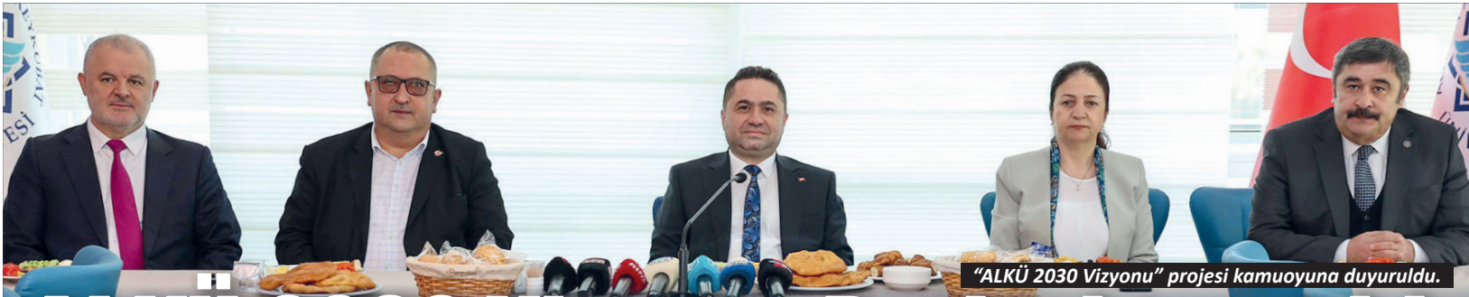
"ALKÜ 2030 Vizyonu" projesi kamuoyuna duyuruldu.