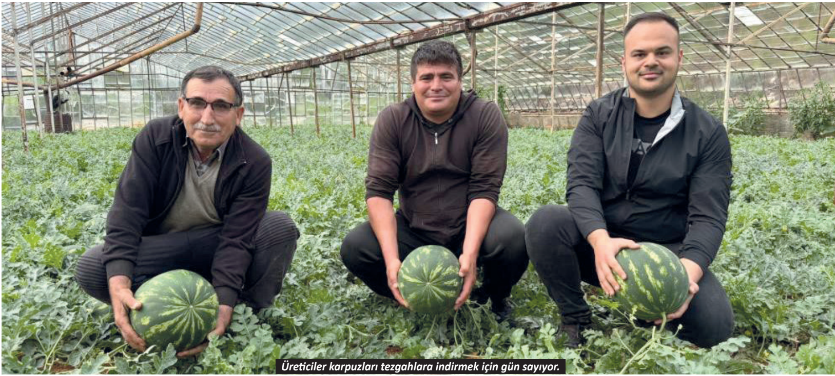
Üreticiler karpuzları tezgahlara indirmek için gün sayıyor.

artış gösterdi. Toplam kargo ve posta hacmi yüzde 8,8 artarak 198,3 bin tona yükseldi. 3 AYDA TOPLAM YOLCU SAYISI 21 MİLYON Yılın ilk çeyreğini kapsayan Ocak-Mart 2026 döneminde ise toplam yolcu sayısı yüzde 12,7 artışla 21,3 milyon olarak gerçekleşti. Aynı dönemde uçuş sayısı yüzde 8,5, ASK yüzde 9,4 artarak 66,7 milyara ulaştı. Doluluk oranı yüzde 83,5 olurken, kargo ve posta hacmi yüzde 14,8 artışla 552,1 bin tona çıktı. Bölgesel bazda Uzak Doğu, Avrupa ve Afrika hatlarında artış görülürken, Orta Doğu hattında yüzde 9,3 daralma kaydedildi. (Kaynak Turizmguccel.com)