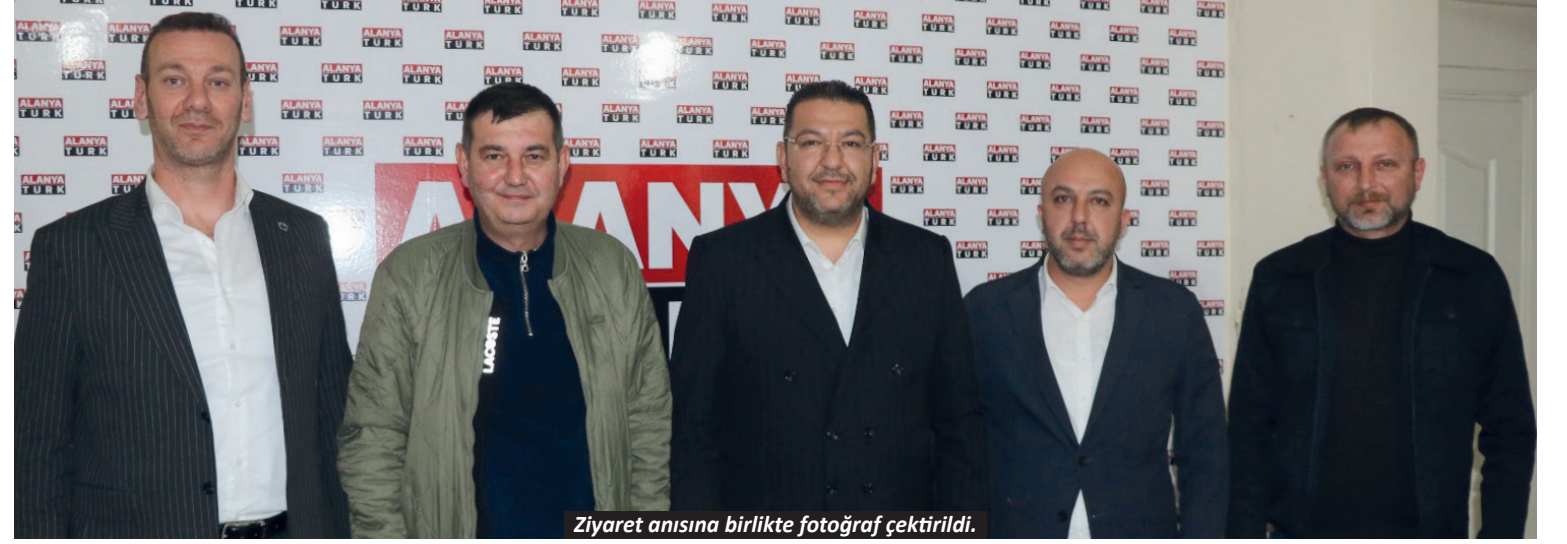
Ziyaret anısına birlikte fotoğraf çekildi.

MHP Antalya İl Başkan Yardımcıları, AlanyaTürk Gazetesi'ni ziyaret ederek yerel ve ulusal gündeme dair değerlendirmelerde bulundu.