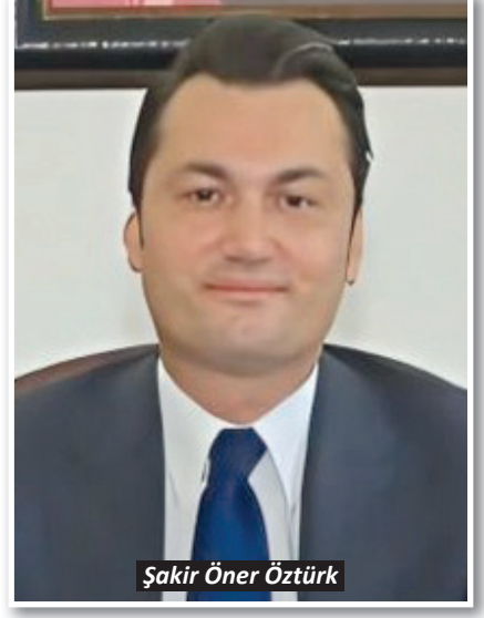
Şakir Öner Öztürk

10 Nisan Polis Haftası nedeniyle yazılı mesaj yayımlayan Alanya Kaymakamı Şakir Öner Öztürk, “Vatanımızın bölünmez bütünlüğü ve vatandaşlarımızın can güvenliği için gece gündüz demeden fedakârca çalışan emniyet mensuplarımız Alanya'mızın huzurlu ve güvenli olmasında en büyük pay sahiplerinden” dedi.