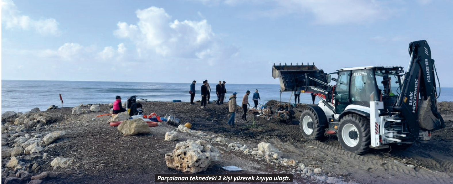
Parçalanmış teknedeki 2 kişi yüzerek kıyıya ulaştı.

kinesi, 1 adet 3 motorlu kompresör, 20 bin adet doldurulmuş makaron ve 15 bin adet boş makaron ele geçirildi. Olayla ilgili adli tahkikat başlatıldığı bildirildi.-İHA