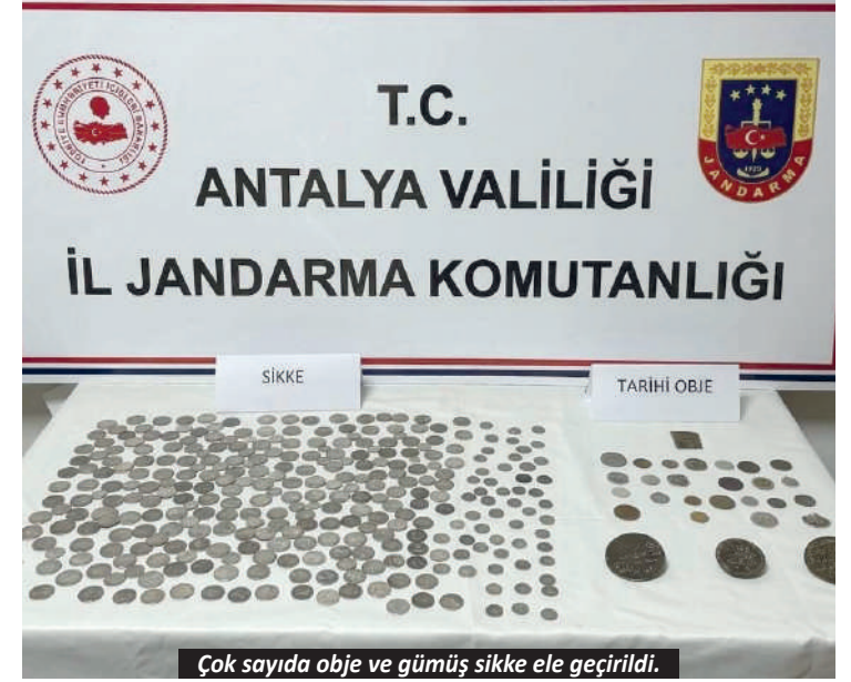
Çok sayıda obje ve gümüş sikke ele geçirildi.

Tarihi eser kaçakçılığına yönelik düzenlenen operasyonda çok sayıda tarihi obje ile gümüş sikke ele geçirildi.