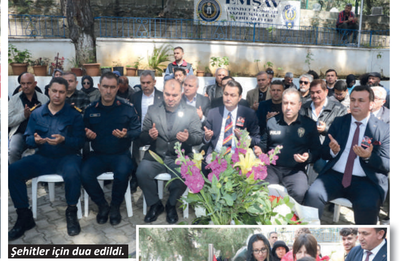
Şehitler için dua edildi.