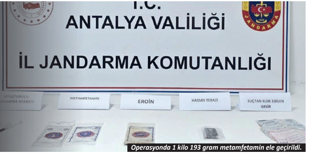
Operasyonda 1 kilo 193 gram metamfetamin ele geçirildi.

cında arama yapıldı. Yapılan aramalarda 1 kilo 193 gram metamfetamin, 10 gram eroin, 1 adet hassas terazi, 5 adet uyuşturucu kullanma aparatı (şiringa) ile suçtan elde edildiği değerlendirilen bir miktar para ele geçirildi. Olayla ilgili şüpheli şahıslar hakkında adli tahkikat başlatıldığı öğrenildi.-İHA