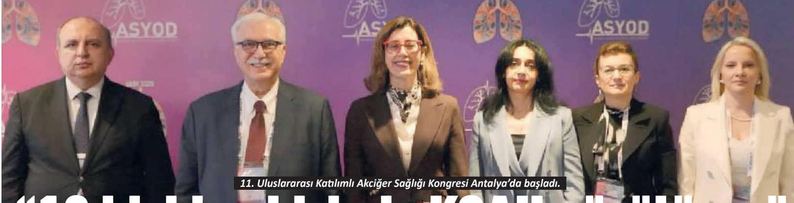
11. Uluslararası Katılımlı Akciğer Sağlığı Kongresi Antalya'da başladı.