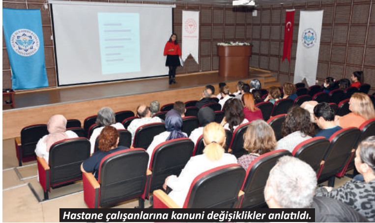
Hastane çalışanlarına kanuni değişiklikler anlatıldı.

Sektördeki fiyat karmaşasına son vermek için somut bir adım attıklarını belirten Özdemir, pazar yerleri ve marketlerdeki çiçek satışlarının disipline edilmesi amacıyla “Fiyat Tarifesi” çalışmalarının başlatıldığını duyurarak “Çiçekçi esnafımız yalnız değildir. Üyelerimizin haklarını korumak için tüm yasal yolları ve idari süreçleri işleteceğiz. Mesleğine sahip çıkarak toplantımıza katılan tüm kıymetli esnafımıza teşekkür ediyorum. Birlikte daha güçlü bir Alanya için çalışmaya devam edeceğiz” ifadelerini kullandı. – Yasemin Kaya