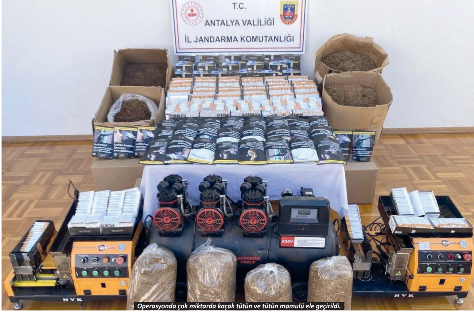
Operasyonda çok miktarda kaçak tütün ve tütün mamulü ele geçirildi.