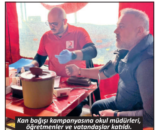
Kan bağışi kampanyasına okul müdürleri, öğretmenler ve vatandaşlar katıldı.

Kira geliri olanlar dikkat Alanya'daki gayrimenkul sahiplerinin 2025 kira gelirlerini 31 Mart'a kadar beyan etmesi gerekiyor. Beyannamenin verilmemesi durumunda bir kat vergi ziyai cezası uygulanıyor. 5'TE