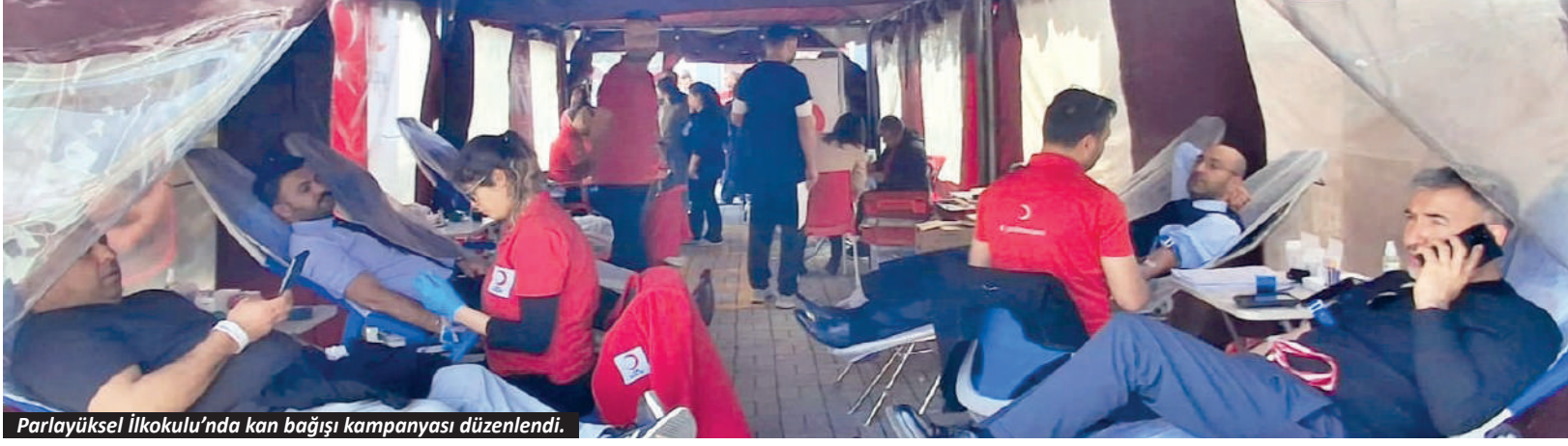
Parlayüksel İlkokulu'nda kan bağışi kampanyası düzenlendi.