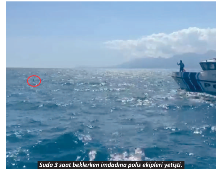
Suda 3 saat beklerken imdadına polis ekipleri yetişti.

Antalya İl Jandarma Komutanlığı'nca yürütülen çalışmalar kapsamında, Kaş Cumhuriyet Başsavcılığı'nın talimatları doğrultusunda ilçede tarihi eser kaçakçılığına yönelik operasyon düzenlendi. Operasyonda, V.K. ve Y.P. isimli şüphelilere ait iş yerinde arama yapıldı. Aramalarda çok sayıda tarihi obje ile gümüş sikke ele geçirildi. Olayla ilgili adli tahkikat başlatıldığı bildirildi.-İHA