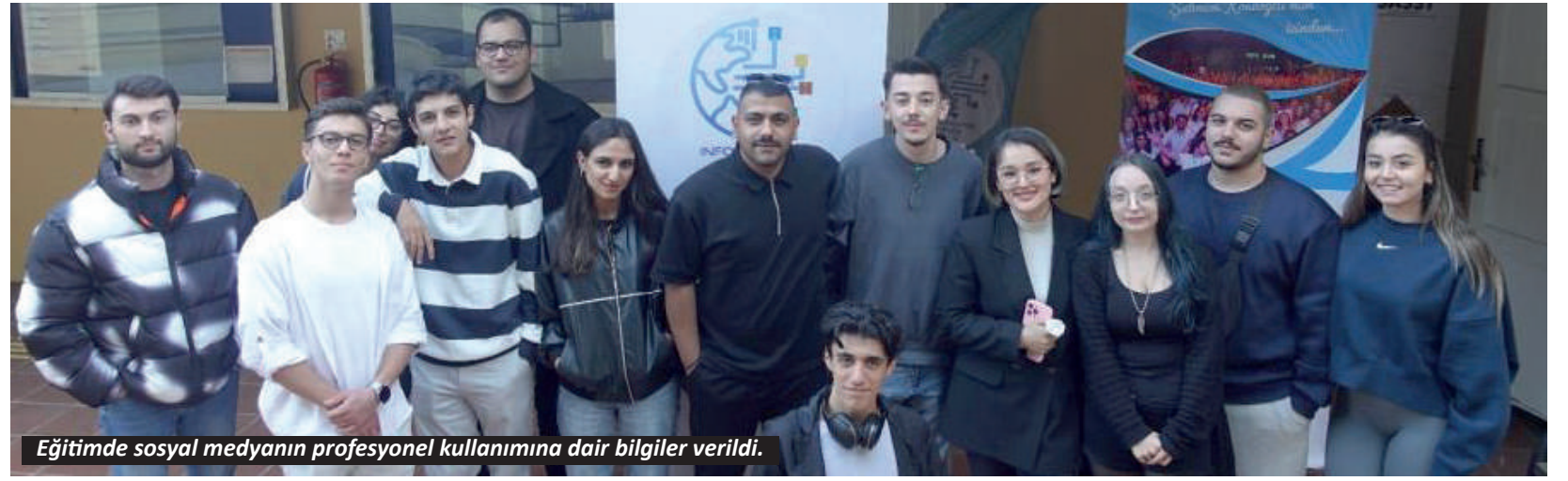
Eğitimde sosyal medyanın profesyonel kullanımına dair bilgiler verildi.

Alanya Üniversitesi, öğrencilerin dijital dünyadaki yetkinliklerini artırmaya yönelik etkinlik düzenledi.