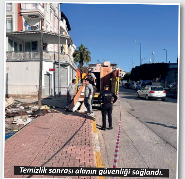
Temizlik sonrası alanın güvenliği sağlandı.

gelen talep ve ihbarları WhatsApp ihbar hattı ile çağrı merkezi üzerinden almaya devam ediyor. 0 555 07 07 07 numaralı WhatsApp hattı ve 444 6 007 çağrı merkezinden bildirimlerin değerlendirilerek kısa sürede müdahaleye dönüştürüldüğü belirtildi. Kepez Belediyesi, 68 mahalledeki ihtiyaç ve talepleri en hızlı şekilde karşılamak amacıyla hayata geçirdiği "Çek Yaz Gönder, Kepez'i Sen Yönet" projesi sayesinde, ilçedeki temizlik hizmetleri de devam ediyor. Bu sistemle vatandaşlar, mahallelerinde gördükleri eksiklikleri fotoğraf, video veya ses kaydıyla belediyeye iletebiliyor. - İHA