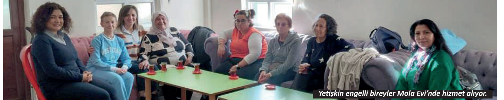
Yetişkin engelli bireyler Mola Evi'nde hizmet alıyor.

Antalya İl Jandarma Komutanlığı, suçların önlenmesi ve aranan şahısların yakalanmasına yönelik çalışmalarını aralıksız sürdürüyor. Bu kapsamda Jandarma Dedektifleri (JASAT) tarafından son 72 saatte yürütülen operasyonlarda, farklı suçlardan aranan toplam 203 kişi yakalandı. Ekiplerin titiz çalışmaları sonucu 10 yıl ve üzeri hapis cezası bulunan 3 şüpheli, 5-10 yıl arası hapis cezası bulunan 19 şüpheli, 0-5 yıl arası hapis cezası bulunan 29 şüpheli, başta olmak üzere çok sayıda aranan şahıs adli makamlara teslim edildi. - İHA