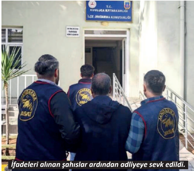
İfadeleri alınan şahıslar ardından adliyeye sevk edildi.

onlara her zaman tam güvendiklerini belirtti. ALKÜ'nün gururları olduklarını söyleyen Rektör Türkdoğan, "ALKÜ olarak spora ve sporculara verdiğimiz önemin meyvelerini her geçen gün daha fazla almaya başlıyoruz. Öğrencilerimizin bu başarıları ülkemizin ve bizlerin gurur oluyorum. ALKÜ olarak spora daha fazla önem vererek uluslararası organizasyonlarda başarılarımızı daha üst seviyelere çıkaracağımıza inanıyoruz. Kararlı hocalarımıza ve azimli öğrencilerimizin alanlarındaki başarıları bizleri her zaman heyecanlandırıyor ve gururlandırıyor. Bu başarılardan ötürü hocalarımızı ve öğrencilerimizi yürekten tebrik ederim." dedi. ALKÜ Spor Bilimleri akademisyenleri de Rektör Türkdoğan'a verdikleri desteklerden dolayı teşekkür ederek, başarılarının devam edeceğini belirtti. Ziyaretler alınan kupa, madalyalarla birlikte çekilen aile fotoğrafı ile sona erdi. - Görkem Çancı