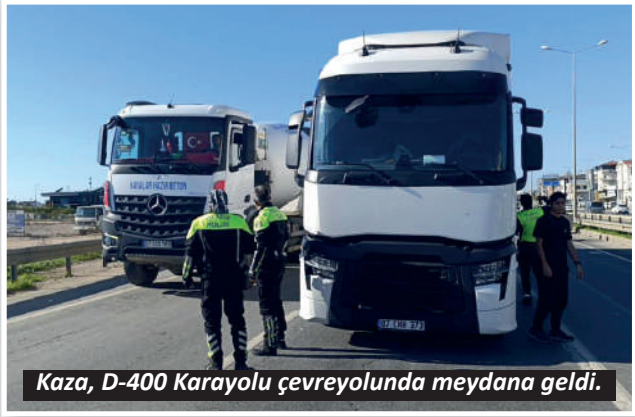
Kaza, D-400 Karayolu çevreyolunda meydana geldi.