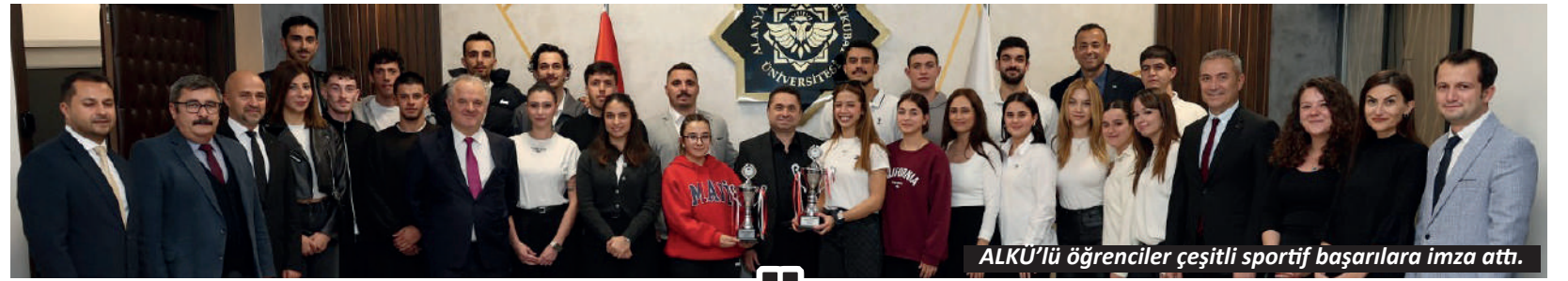
ALKÜ'lü öğrenciler çeşitli sportif başarılarına imza attı.

olarak düzenlenen eğitim, özellikle sosyal medya alanına ilgi duyan öğrencilerden yoğun ilgi gördü. Alanya Üniversitesi, öğrencilerini dijital çağın gereklilikleri doğrultusunda destekleyen uygulamalı eğitimlerle mesleki ve kişisel gelişimlerine katkı sunmayı sürdürüyor. - İHA