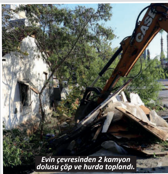
Evin çevresinden 2 kamyon dolusu çöp ve hurda toplandı.

lerinin yanı sıra meditasyon ve farkındalık çalışmaları yapıyor. Kemer Belediye Başkanı Necati Topaloğlu, "Mola Evimizde çocuk ve genç yaşta engelli bireylerin yanı sıra yetişkinlere de hizmet vermeye başladık. Mola Evimizde personelimize sohbetler ediyor hem de sosyal aktivitelere katılıyorlar. Her insanın bir engelli adayı olduğunu unutmuyor ve engelli vatandaşlarımıza en iyi hizmeti vermek için gayret gösteriyoruz" dedi. - İHA