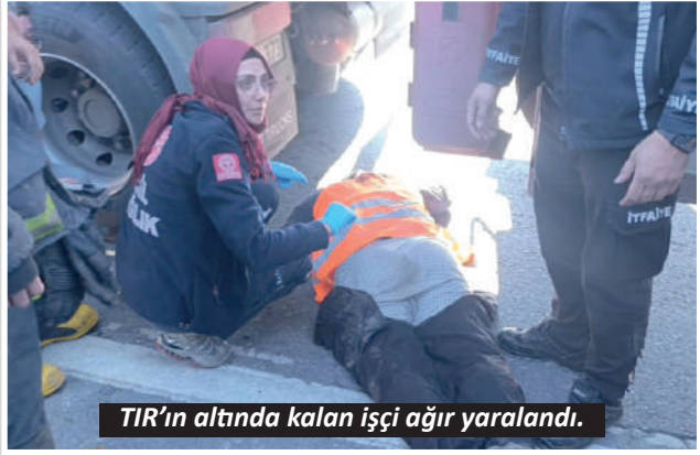
TIR'ın altında kalan işçi ağır yaralandı.

Manavgat'ta D-400 Karayolu çevreyolunda yapılan bakım çalışmasında görevli karayolları işçisi TIR'ın altında kalarak ağır yaralandı. Taşeron firmada çalıştığı bildirilen 61 yaşındaki işçi hastanede yapılan müdahalelere rağmen hayatını kaybetti.